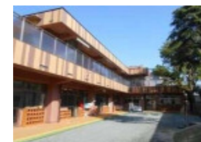
改修工事実施後の園舎の様子