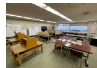
適応指導教室（教育センター）