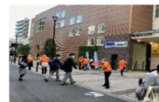
児童虐待防止街頭キャンペーン