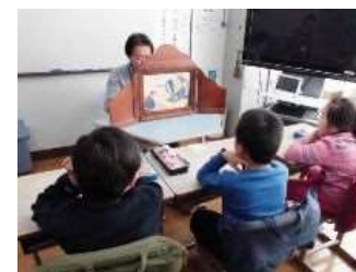
日本語学級の授業 （日本の昔話を読む）