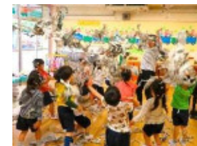
感性を養う幼児教育

【主な事業】 区立幼稚園における教育・保育サービスの充実／区立幼稚園の認定こども園化