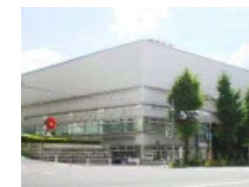
教育センター全景 (教育センター)

子どもの成長に伴って生じてくる様々な心配事や悩みについて、来所あるいは電話による相談を受け付けています。臨床心理士等の相談員が子どもの状態や状況を把握し理解したうえで必要に応じて発達検査・カウンセリング等を行い関係機関との連携も取りながら支援を行っています。 [主な事業] 教育相談等充実事業