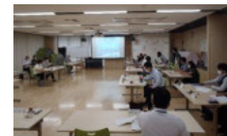
学校運営協議会の様子

【主な事業】 学校・地域の連携推進事業／インターナショナルセーフスクール推進事業