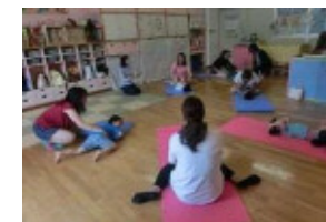
児童発達支援事業

[主な事業] 児童発達支援事業／子ども若者総合相談事業／子ども若者応援基金運営事業