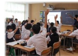
自分の意見を持ち、他者の考えを認め合う授業

コロナ禍の中、心のケアを要する児童・生徒が多数認められ、安全安心な学校への期待が一層高まっています。人権教育を推進し、児童・生徒に規範意識を身に付けさせる指導、自己肯定感を高める指導、互いを認め合う学級風土を醸成する指導の充実を図ります。また、心理検査の結果を活用し、専門家や区民の参加する委員会において、いじめ防止に向けた総合的な取組指針を取りまとめ、「いじめをしない・させない」心を育てていきます [主な事業] いじめ防止対策推進事業／教育相談等充実事業