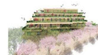
池袋第一小学校新校舎イメージパース

【主な事業】学習環境の充実／池袋第一小学校、千川中学校、 要小学校の改築 ／旧平和小学校複合施設の整備 等