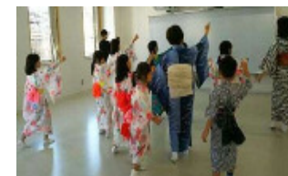
放課後子ども教室