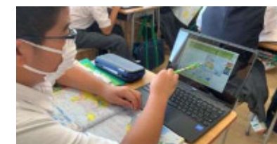
「個別最適な学び」を実現した授業