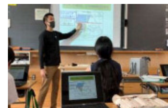
一人1台タブレットパソコンを活用した授業