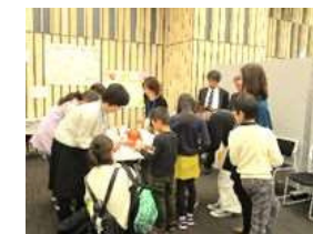
家庭教育推進員学習発表会の様子 (令和元年度)

共働き世代が増える中、地域における地縁的なつながりの希薄化などが指摘されています。家庭だけでなく、子どもスキップ・学校・地域等を巻き込んだ情報提供や支援、学びの機会の創出を通じて、誰もが安心して地域の中で教育活動が行える環境と、家庭教育の支援を充実していきます。 [主な事業] 家庭教育推進事業、子どもスキップ事業、放課後子ども教室事業等