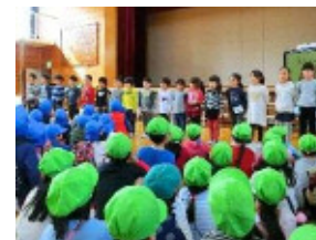
幼稚園と小学校の交流会 (小学校体験交流)

【主な事業】 区立幼稚園における教育・保育サービスの充実／区立幼稚園の認定こども園化