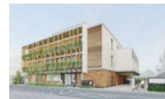
児童相談所の完成イメージ図

〔主な事業〕 社会的擁護基盤構築事業／人材育成等関係事業／長崎健康相談所・児童相談所等の整備