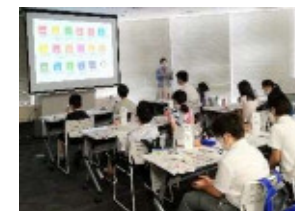
としま子ども会議