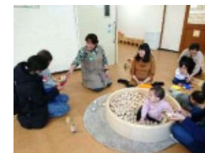
子ども家庭支援センター