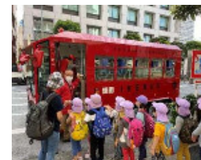
IKEBUSを活用した園外保育の充実