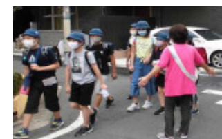
地域・保護者による見守り活動