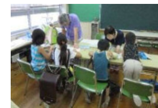
地域人材を活用した放課後学習教室

新型コロナウイルス感染症への不安も加わり、様々な要因により、困難を抱えた児童・生徒が増加しています。職場体験や地域におけるボランティア活動等、地域人材を活用した事業を継続し、子供が地域や関係機関との交流や体験をすることにより、学校と地域と関係機関が連携して育てる機運を醸成します。 [主な事業] 「豊かな心」育成事業