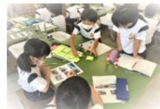
「協働的な学び」の授業