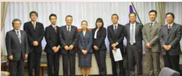
【第1期ワーク・ライフ・バランス推進認定企業】