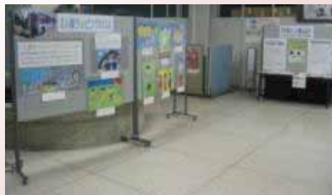
【人権週間パネル展】

また、人と人との交流を大切にし、お互い に相手を思いやり、尊重する地域社会を築きます。