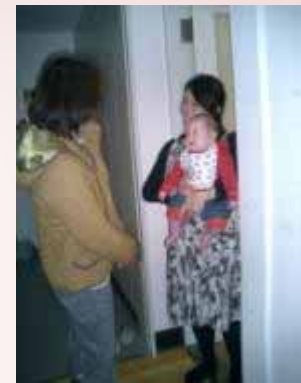
【子育て訪問相談事業】

小学生・中高生等が安心していきいきと過ごすことができ、自主的な活動や子ども同士の交流等ができるよう、子どもの居場所・活動の場を整備します。