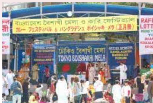
【イベントでの交流】

人種や国籍などを問わず、共に豊島区に 暮らす区民として、共に地域を創っていく ための環境を整備します。