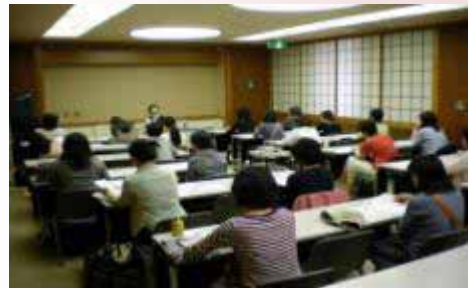
【エンパワーメント講座】