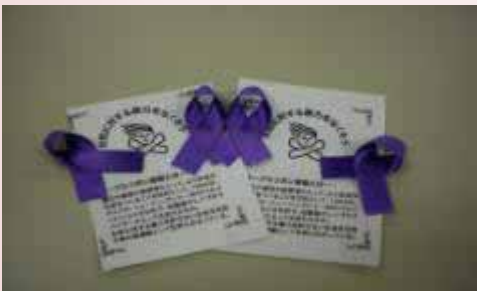
【女性に対する暴力をなくす運動】