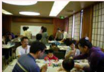
【登録団体との共催講座】