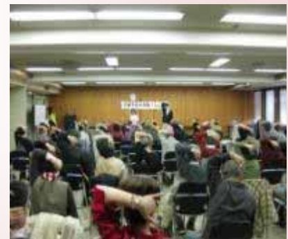
【介護予防イベント】