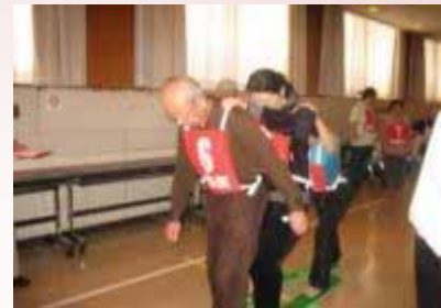
【介護予防イベント】

介護保険や障害者福祉制度において適切なサービスの選択ができるよう、利用者に的確な情報を提供するとともに、良質なサービスが提供されるようなしくみづくりをすすめます。また、権利擁護体制のネットワーク化、虐待対応の取り組みなどをすすめます。