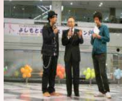
【がん検診勧奨イベント】

支援を必要とする人が安心して地域生活を送れるよう、社会保障制度の適切な運用とあわせ、支援策の充実を図ります。