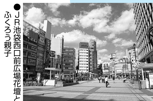
●美しい街並みづくり賞