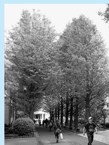
●大正大学集鴨キャンパス

美しく、品格があり、人々にうらおいを与える、みどりあふれる街並みの形成は、区の価値ある街づくりの課題であり目標でもあります。この課題を「美しい街並みづくり」という言葉に集約して、この事業を実施しています。