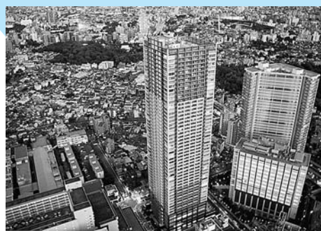
■SKY BLUE 2