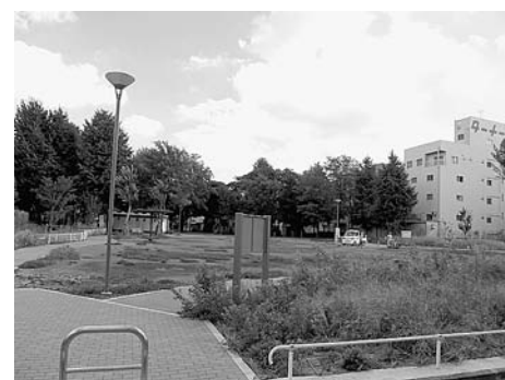
●南長崎はらっぱ公園