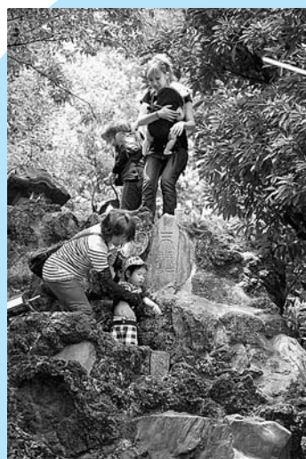
■ときめきの八合目 (池袋富士お山開き)