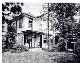
雑司が谷旧宣教師館 所在地: 雑司が谷1-25