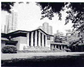
自由学園明日館 所在地: 西池袋2-31