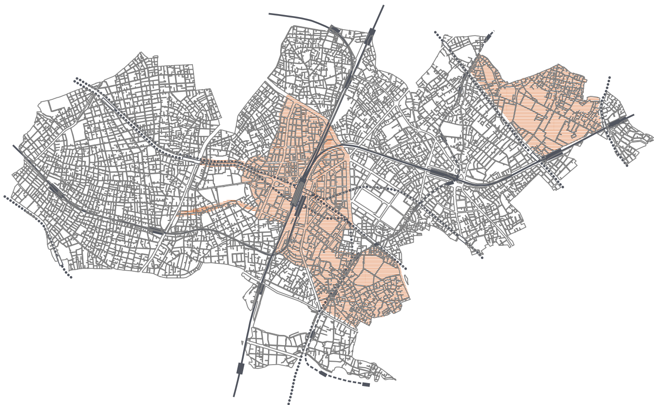
図1-14 アメニティ形成特別推進地区