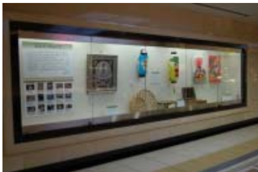
【エチカ池袋ギャラリー】