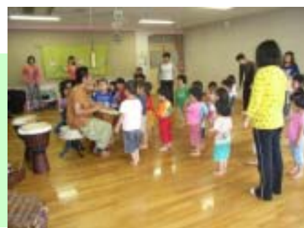
【子どものための文化体験プログラム】