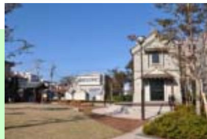
駒込地区【門と蔵のある広場】