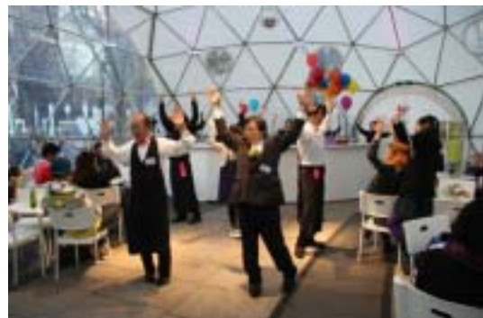
【フェスティバル/トーキョー】