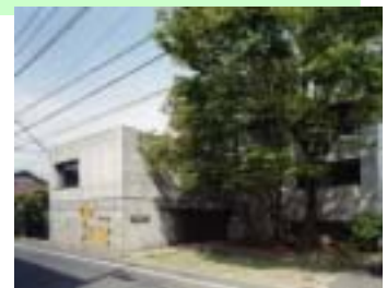
【豊島区立熊谷守一美術館】