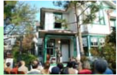
【雑司が谷旧宣教師館】