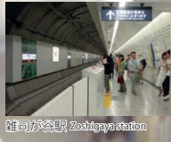
雑司が谷駅 Zoshigaya station

With the debut of the Tokyo Metro Fukutoshin Line linking Ikebukuro with Shinjuku and Shibuya on June 14, 2008, Zoshigaya station was newly opened in Toshima City. The city now boasts a network of five rail companies and 12 rail lines, as well as Tokyo's only tram line, the Arakawa Line, providing convenient and flexible travel.