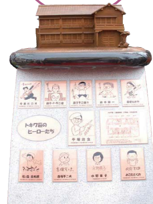
トキワ荘記念碑 Monument for Tokiya-so