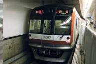
新型車両10000系 New 10000-Type Train