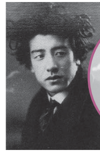
小熊秀雄 Hideo Oguma

昭和のはじめから戦前にかけて、豊島区の西部地区にあたる長崎・千早・千川地域には、アトリエ付貸家が並んでおり『アトリエ村』と呼ばれました。そこに居住した多くの若き芸術家たちが、池袋西口一帯を舞台として、多彩な創作活動や交流を展開した様子をパリにある芸術の聖地にちなんで『池袋モンパルナス』と名づけたのは詩人の小熊秀雄。大正から昭和にかけて活躍した画家、熊谷守一も豊島区千早で創作活動をしていました。