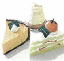
キャロットチョコフラン480円(左)グリーンショート・トマト450円(右)モンブランクイーン450円(奥)。

ヨーケースに並ぶのは、どれも野菜が主役のケーキたち。「身体に優しいスイーツ」をテーマに、自然素材を厳選しています。スッキリとした野菜の甘みは、一瞬、野菜を素材にしているとは気づかないほど。口いっばいに広がってそれが「野菜」の旨みと気がつくときには大ファンに！身体に優しい＆おいしいスイーツを、ぜひ、ご堪能あれ。