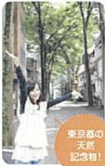
東京都の天然記念物！

副都心線「雑司が谷」駅1番出口の階段を上ると、目の前をキュートな電車がガタンゴトン…。停車したのは都電荒川線の「鬼子母神前」駅。懐かしい昭和な雰囲気がステキです。都電の線路を渡ると鬼子母神の参道「ケヤキ並木」が続きます。中には樹齢400年の大木もあって、東京都指定の天然記念物にも選ばれているとのこと。参道をしばらく行くと現