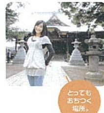
とてもおちつく場所。

「鬼子母神」の本堂は江戸時代初期の建立。東京都の有形文化財にも指定されています。普設は静かなこの場所も10月16日〜18日に行われる「御会式」の日は参道に露店並び、多くの人で賑わうといえます。