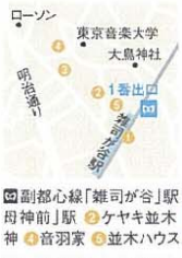
副都心線「雑司が谷」駅 1番出口