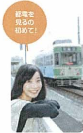
都電を見るの初めて！

副都心線「雑司が谷」駅1番出口の階段を上ると、目の前をキュートな電車がガタンゴトン…。停車したのは都電荒川線の「鬼子母神前」駅。懐かしい昭和な雰囲気がステキです。都電の線路を渡ると鬼子母神の参道「ケヤキ並木」が続きます。中には樹齢400年の大木もあって、東京都指定の天然記念物にも選ばれているとのこと。参道をしばらく行くと現