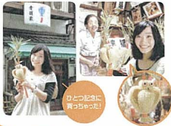
ひとつ記念に買った！

そして鬼子母神といば、有名な郷土玩具のすずみみずく。境内からすぐ近くの「音羽家」さんで、この道40数年のお母さんが一つひとつ手づくりしています（土・日曜のみ営業）。お参りをすませて、かわいいみみずくを買ったところで、再