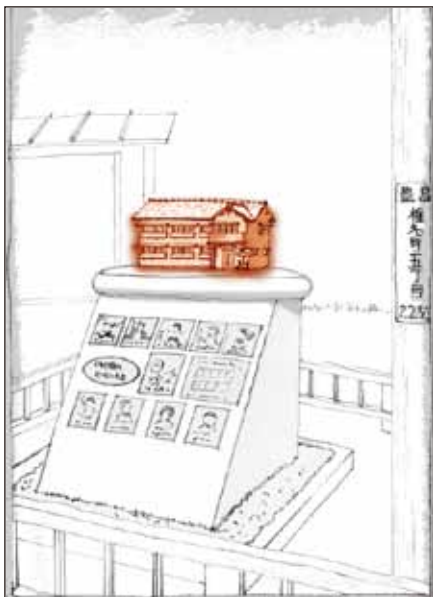
① 記念碑「トキワ荘のヒーローたち」