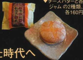
▼チーズバターと杏ジャムの2種類、各160円