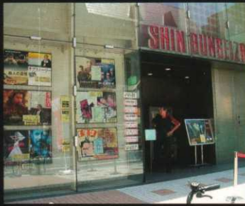
▶2000年12月にリニューアルした新文芸坐