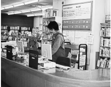
カウンター業務を委託化した千早図書館

問 区は昨年10月に、「公共施設の再構築・区有財産の活用」(本提案)を示した。これは、2001年発表の「同活用の本提案」を修正したものだ。区民の切実な要望が反映されておらず、資産の売却・貸付け箇所を倍以上に増やした。財政面からだけみた案である。そこで、(1)素案では、学校跡地は売却せずに近隣公園として整備するとしていたが、本提案では、財政状況によって売却の可能性があるという方向に変更した。学校を含め施設・用地は全て区民の貴重な財産。本提案記載の、学校跡地等の活用は当たり売却・貸付け等の資産活用を検討する旨の文言は、削除すべき②本提案は期間20年で実施するといいうが、区の基本計画の期間10年と合致させるべき。 区長 ①削除しない②本提案の内容を、計画にどう盛り込むかは、区民の意見等を踏まえ整理 問 (2)「みどり」と広場の基本計画では、一人当たりの公園面積を1.5㎡として目標を設定。23区公園面積最下位の本区において、学校跡地を、区の財源とするための売却や貸付けは許されない。同計画は反故にするのか 区長 反故にするものではない 問 (3)「建替え等を契機に区立保育所の民営化を進める」というが、いま保育行政の急務である待機児解消の具体的計画が欠落している。民営化推進は撤回し、区が責任を持って建替年次計画を立て、改築せよ。 区長 撤回はしない。計画は早期に報告できるようにしたい。 問 (4)①本提案では、中央・駒込・目白図書館を廃止、中央・目白は売却予定だが、街の歴史や文化は、施設と地域と住民が作ってきたものであり、それを無視した廃止や合併は中止すべき②東池袋四丁目再開発ビルに開館予定の新中央図書館は、面積を当初計画の半分に削った。更に、図書館を3館減らすことについて、教育委員会の考えは。 区長 ①教育委員会の検討結果を踏まえ、判断していく。 教育長 ②新中央図書館として十分機能するものと認識。今後機能的な図書館配置について検討を進めていく。 問 (5)放課後対策である全児童クラブ等について、①地域区民広場構想に基づき、学童クラブ