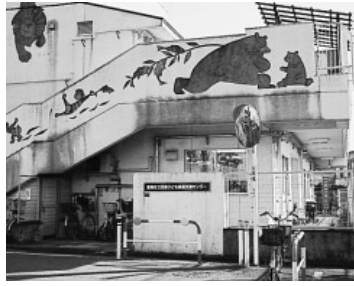
西部子ども家庭支援センター

問 (6)東西子ども家庭支援セン ターは一か所にし、子育て広場 にする計画だが、西部の障害児 発達支援事業はどこで行うのか。 助役 統合後の子ども家庭支援 センターで展開していく考え。