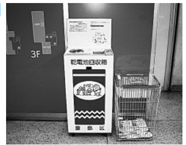
回収後の処理・輸送先の再検討を

問 五感で感じる街づくりにつ いて、①区は都市計画マスター プランに基づき、住みやすい街 づくりを取り組んでいるが、嗅 覚、におい・かおりといった感 覚からの視点は盛り込まれてい るのか②池袋・大塚駅周辺の悪 臭対策に積極的に取り組むなど、 区として街づくりの視点からの 踏み込んだ対策を執行すべき③ かおりの風景づくりという視点 を街づくりの中に取り入れるこ とについての考えを伺う。