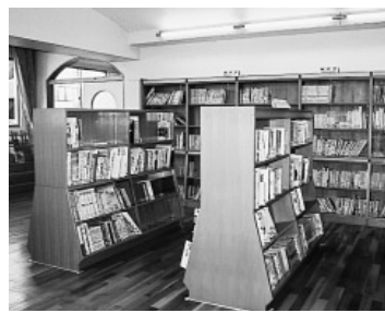
学校図書室(朋有小学校)

教育長 ①図書室とコンピュー タ室の隣接等、利用しやすい図 書室を目指す②蔵書数が不十分 な学校も多い。選定は、各分野 バランス良く揃えることが基準 ③具体策の検討を深める④更に 積極的に推進⑤朝の読書活動等 の他、意欲向上に取り組む。