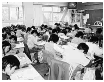
学校のアレルギー疾患への取組みは

問 都市型災害対策について、(1)「ターミナル駅前滞留者対策訓練」の実施に向けての現状は(2)「外出者の行動ルール」等の