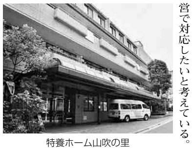
特養ホーム山吹の里

を整備するとしているが、介護報酬の引下げのもとでは民間が新たに参入してくるとは考えられない。区が直接つくるべき。 副区長 これまでどおり区民民営で対応したいと考えている。