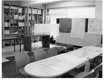
アトリエ村資料室

区長 (1)全庁的な都市政策として戦略的に取り組む(2)観光戦略とともに策定委員会で十分に検討(3)地域ブランドの活性化策を、シティセールスの観点から横断的にプロモーション活動を検討。 問 池袋モンパルナスとアトリエ村は美術史上の文化的意義が大きい。これに注目する姿勢について、(1)シティセールスの視点(2)調査研究の推進体制は。 区長 (1)全国に向け発信できる最大の財産と認識(2)「仮称」西部地域複合施設にギャラリー等を