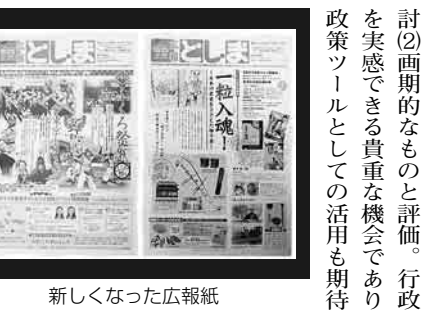
新しくなった広報紙

区長 (1)概ね良い評価と認識。新コーナー等の新設は、今後具体化を図る。区民参加の広報紙づくりは、引き続き積極的に検討(2)画期的なものとして評価。行政を実感できる貴重な機会であり、政策ツールとしての活用も期待。