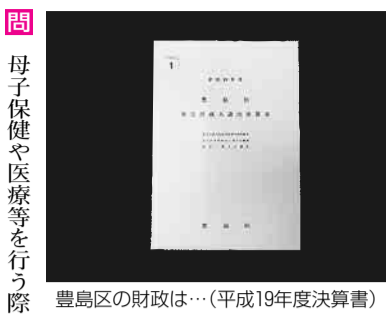
豊島区の財政は…(平成19年度決算書)

副区長 介護と医療の連携について、(1)在宅療養支援診療所制度への届出を控える診療所数及び支援診療所の区内の実態は(2)在宅診