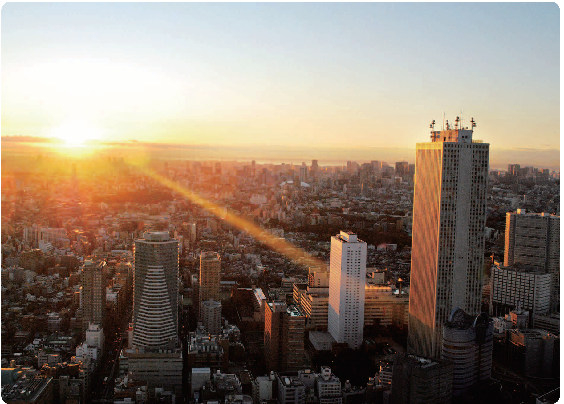
豊島区をのぞむ ～豊島清掃工場から～