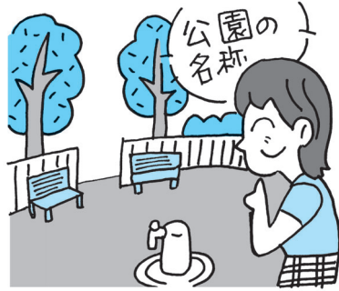
公園等の名称には地元の意見の反映を

問 今年度より自主運営に着手。区民提案を街づくりに生かすことにもつながっていくと期待。