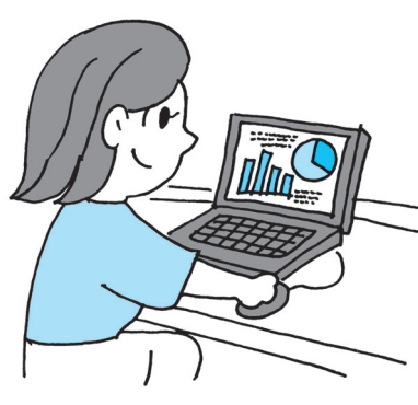
メディアリテラシー向上への取組みは

問 規制強化の動きが相次いでいるがメディアから遠ざけることには限界がある。実状を的確に捉え、子どもたちのメディアリテラシーの醸成が必要では。