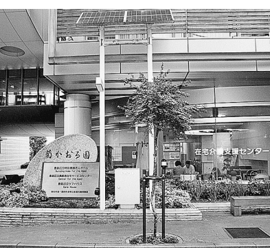
特別養護老人ホーム菊かわる園