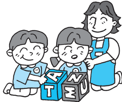
区立幼稚園の今後は