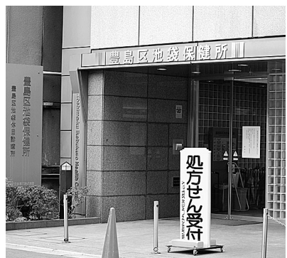
区のがん対策は(池袋保健所)