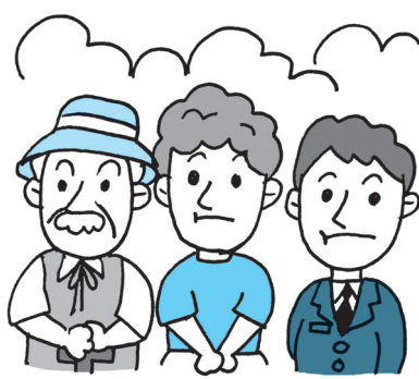
新庁舎計画について区民の民意を問うべき

民の民意を問うべきでは。 答 区民説明会やパブリックコメントの意見からも区民の皆様への理解が得られていると認識しており、これからも区民説明会等で丁寧な説明していくので、改めて民意を問う必要はないと考えている。