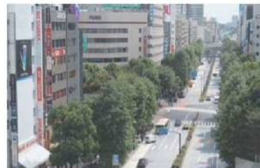
図表 8-8 グリーン大通り