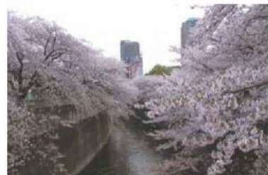
図表 8-7 神田川