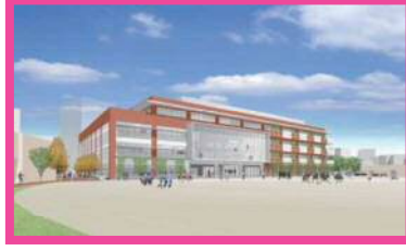
⑤巣鴨北中学校整備