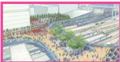
②池袋駅東西デッキ（南デッキ）整備