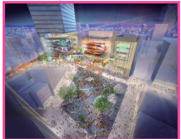
⑨庁舎跡地周辺整備