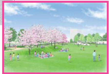
⑧造幣局地区防災公園