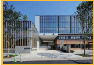
④池袋本町地区 校舎併設型小中連携校 (H28.6 竣工)