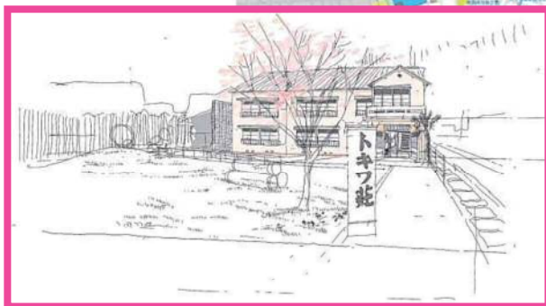
⑧（仮称）マンガの聖地としまミュージアム整備事業