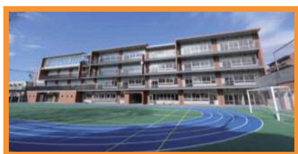
⑥池袋第三小学校（H28.12 竣工）