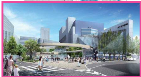
⑦池袋西口公園整備