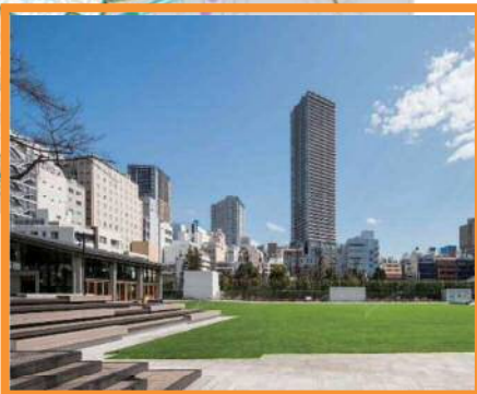
⑪南池袋公園 (H28.4 全面開園)