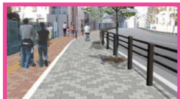
③補助 173 号線（H30.3 竣工）