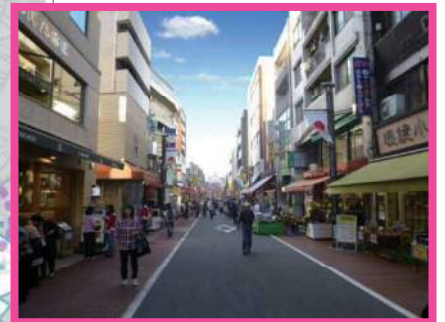
⑦巣鴨地蔵通り無電柱化