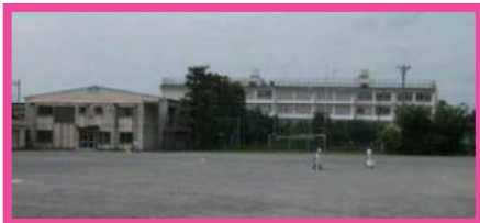
①旧第十中学校跡地活用等事業