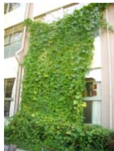
【池袋小緑のカーテン】