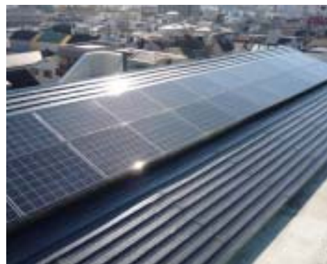
【区営池袋本町二丁目住宅】