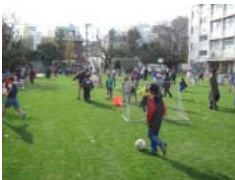
【清和小校庭芝生化】