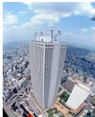
【サンシャインシティ 外壁窓高反射フィルム整備】