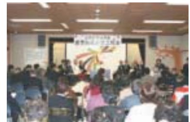
【区民ひろば運営協議会】