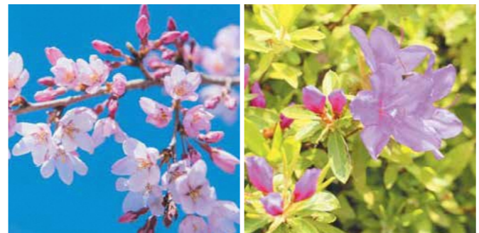
区の木……ソメイヨシノ