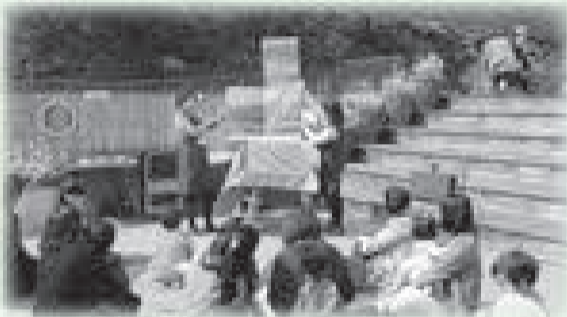
▲同店屋上「食と緑の空中庭園」での「図書館司書のわくわくおはなし会」