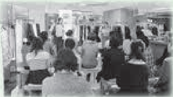
▲同店婦人服売場での「時短&キレイでママ応援！育休復帰セミナー」