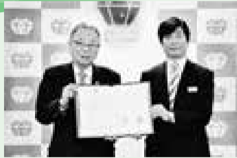
▲協定締結式での区長と西武池袋本店長

(※)FFとは、Female/Family Friendly(女性/ファミリーにやさしい)の略です。