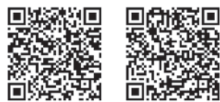
▲携帯電話 ▲スマートフォン

②郵送・持参で 登録用紙を区ホームページからダウンロードし、学習・スポーツ課へ提出してください。 ※活動に際し、保険に加入します。保険料は区が負担します。