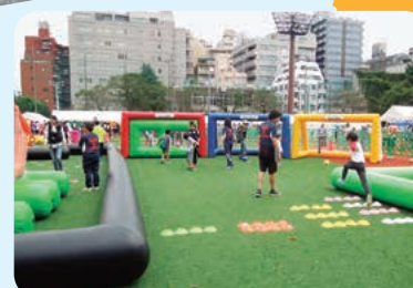
▲各種スポーツイベントの運営サポートをお願いします