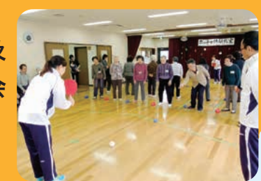
▲「ポッチャ」はパラリンピックの正式種目にもなっています