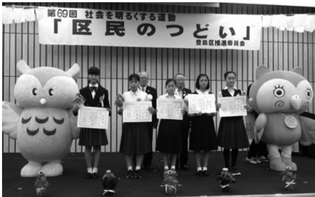
作文コンテスト表彰式(中学生の部)