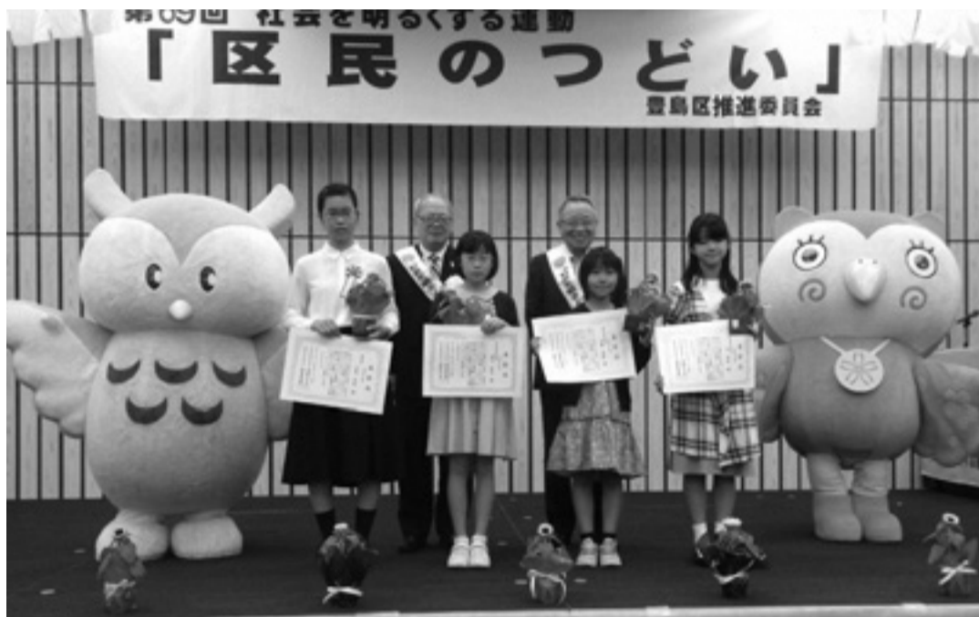
作文コンテスト表彰式(小学生の部)