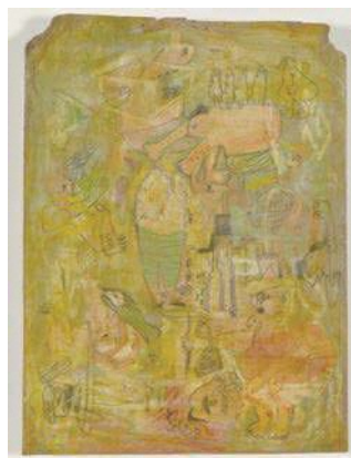
アートオリンピック2015 一般部門3位・学生部門1位 吳雨軒(Yuxuan Wu) 「Cypher of Pixie」(台湾)