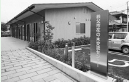
交流拠点となる「花の木交流センター」

●区役所本庁舎・店舗の自転車駐輪場(駐車場を除く)は、3時間無料です。3時間を超えると原則有料です。🏠庁舎運営グループ☎4566 - 2731