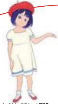
キャラクターデザイン…久野暎子

豊島区(日本)、西安市(中国)、仁川広域市(韓国)の年間を通じた文化交流プロジェクト「東アジア文化都市」。この秋、国際アート・カルチャー都市構想のシンボルであるHareza池袋がオープンするとともに本プロジェクトも閉幕を迎えますが、オールとしまで「まち全体が舞台の誰もが主役になれる劇場都市」を創出し、世界に広がる新たな舞台の幕が開けます。