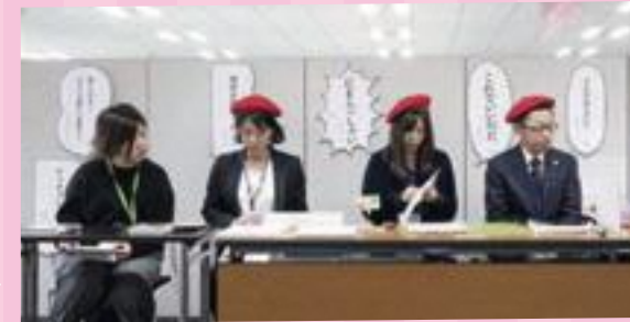
▲東アジア文化都市2019豊島 「区庁舎がマンガ・アニメの城になる」の様子