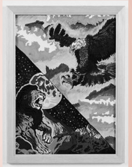
▲社会福祉協議会会長賞 「空の皇帝 VS 百獣の王」高橋弦也