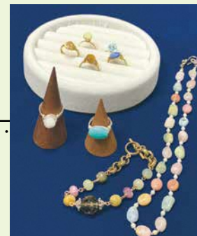
▲ハンドメイドの天然石アクセサリ

小さな頃からものをつくるのが好きで、会社に勤めながらハンドメイド作家として活動していました。一度開催したワークショップを機に、ものづくりは人に教えることで、一緒に楽しめるという魅力の深さを感じられました。そこで、子どもからおとなまでものづくりを楽しんでもらいたいという想いからワークショップを開催しています。手づくりが苦手な方もいますが、想像より簡単にできて楽しかったという声をもらって、とてもうれしく励みになります。ものづくりはアイデアの具現化。頭に思い浮かべたデザインを試行錯誤しながらイメージに近づけていくことが、なによりの醍醐味です。実は、将来の目標は発明主婦になること。これまでの経験を活かして、日常のちょっとした「困った」を解決できるようなアイテムを考案していきたいです。MONOづくりメッセは初出展ですが、たくさんの人とつながることが楽しみです。