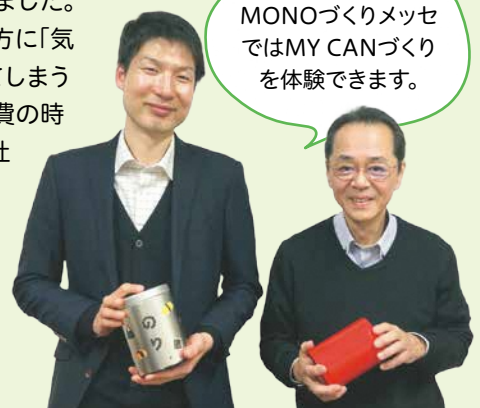
MONOづくりメッセではMY CANづくりを体験できます。

普段目にしていない商品のパッケージや食品の製造などで、古くから区内産業を盛り上げている企業の方に、商品の裏側にあるものづくりへの想いを伺いました。