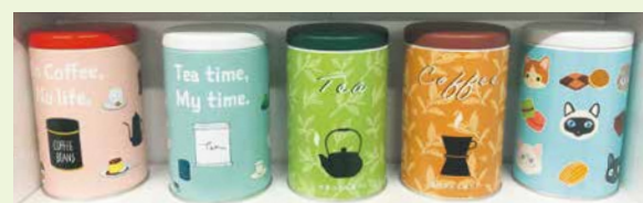
▲小ロットから受注可能なオリジナルプリント缶

昭和21年に区内製薬会社の薬を入れる缶をつくるところから始まりました。時代とともに、海苔やコーヒーなどの缶づくりに移行し、開発を続けています。オリジナルの「防湿リング缶」もそのひとつで、食品を直射日光や湿気から守りたいというお客様の声から、気密性・防湿性にこだわり開発しました。ものづくりで大切なことは、製品を手にとった方に「気持ちよく使ってもらおうこと」。食品の缶を捨ててしまう方は多いと思いますが、近年、大量生産・消費の時代は終わりを迎えています。持続可能な社会に向けて、会社として貢献できることは、繰り返し使えるものをつくることです。デザイン性も含めて、気密性・防湿性という付加価値の高い缶づくりに力を入れ、今後も「お客様に喜ばれる」ことを第一に挑戦し続けていきたいです。