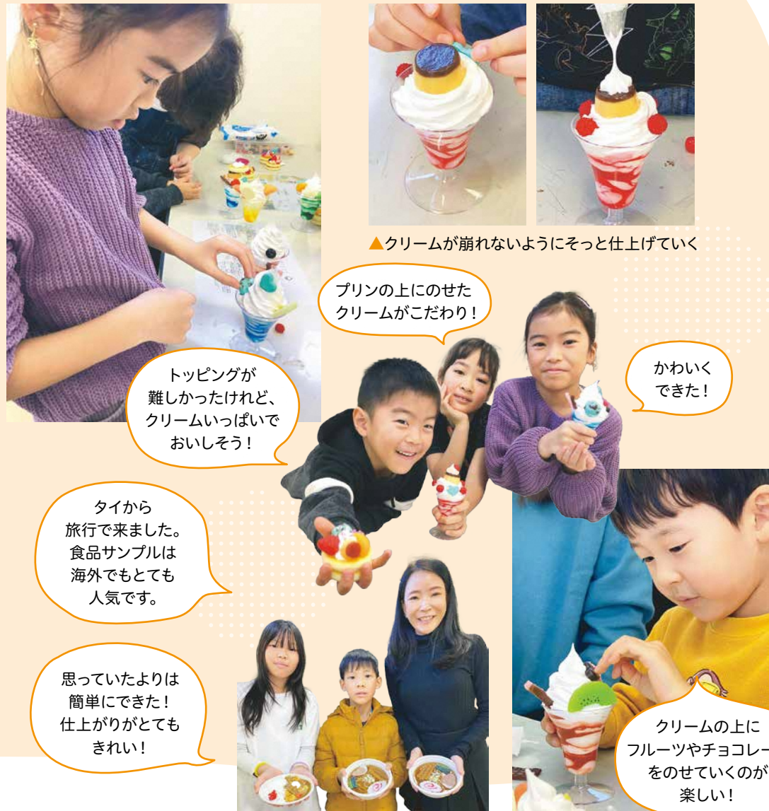
▲クリームが崩れないようにそっと仕上げている