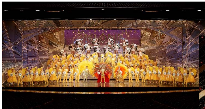
宝塚歌劇（イメージ）

女性たちの声を反映した エリアコンセプト 1000万の きらめく物語が生まれるまち