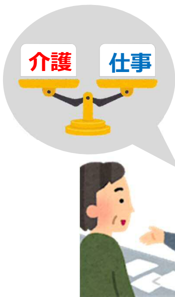
介護サービスの案内