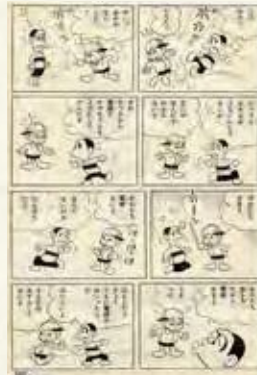
1961年「ナマちゃん」赤塚不二夫