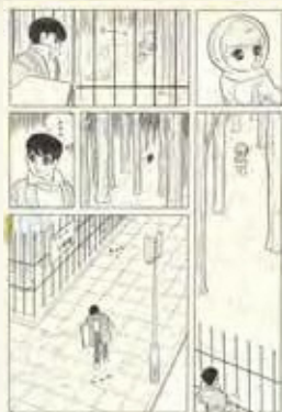
1961年「きのうはもうこないだがあすもまた…」 石ノ森章太郎

1938年生まれ。高校1年時に設立した東日本漫画研究会にて赤塚と出会い、以後生涯にわたって交流を深めていく。高校2年時にデビューし、卒業と同時に上京。1956年～1961年、トキワ荘に入居し「龍神沼」などを執筆。以降「サイボーグ009」「佐武と市捕物控」「仮面ライダー」「HOTEL」など多彩なジャンルの作品を描き、マンガ文化を捉えなおすべく「萬画(まんが)宣言」を発表。これらの功績から萬画の王様と称される。