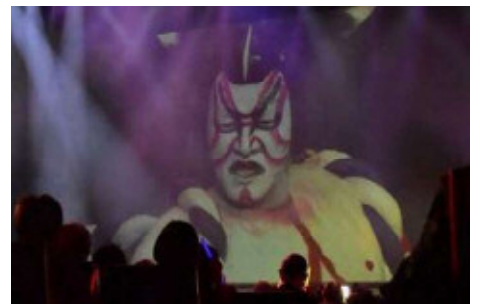
撮影：豊島区／©超歌舞伎 Supported by NTT