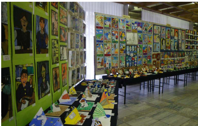
◀小中学校連合作品展覧会

※ 新庁舎の整備状況・資料につきましては区のホームページに掲載されています。 http://www.city.toshima.lg.jp/chosha/index.html