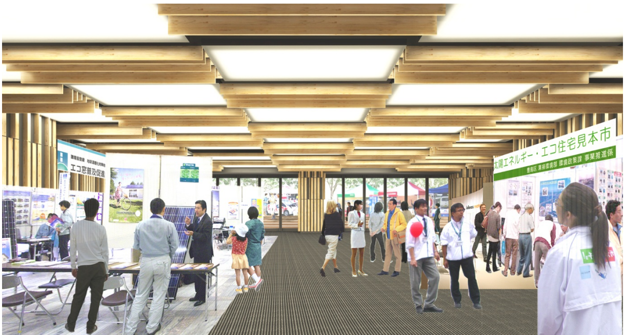
▲啓発イベントのイメージ（合成）