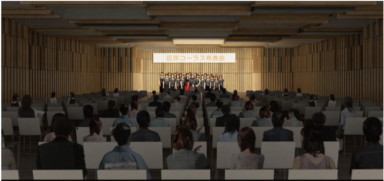
▲発表会のイメージ（合成）