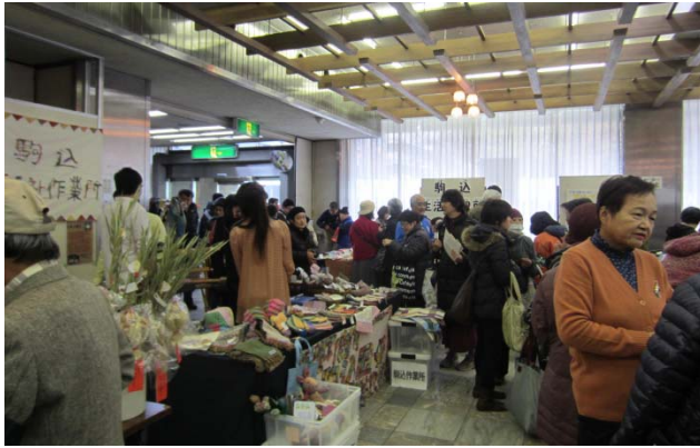
◀ふくし健康まつり