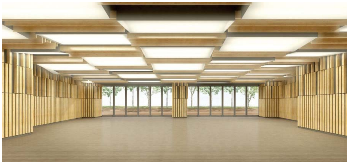
▲多目的スペースのイメージ (合成) (室内から屋外の広場を見たイメージ)