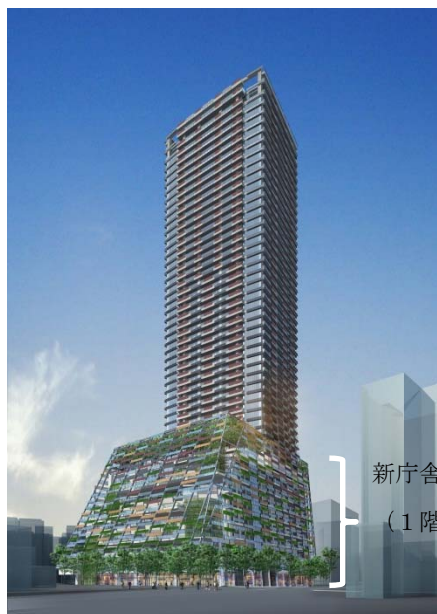
新庁舎 (1階の一部と3～9階)