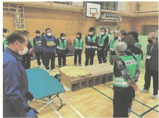
居住スペース作成・展示