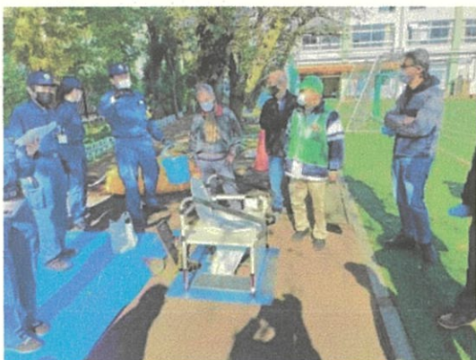
マンホールトイレ展示・体験