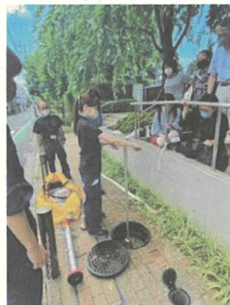
応急給水栓展示・体験