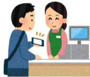
スマホでキャッシュレス決済