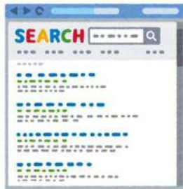
気になるニュースを検索