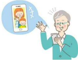
お孫さんとテレビ電話