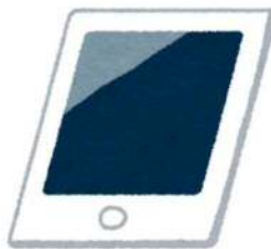
打合せ用タブレット