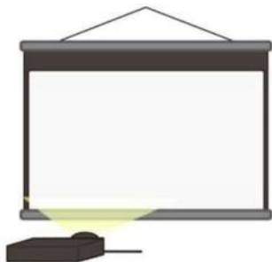
プロジェクター・スクリーン