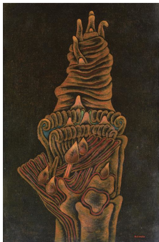
寺田政明 《芽 A》1940 年 豊島区蔵