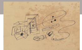
寺田政明 《題不詳》 豊島区蔵