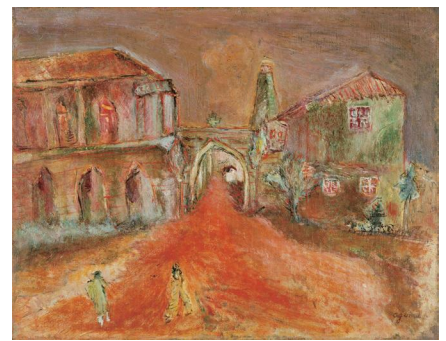
小熊秀雄 《夕陽の立教大学》 1935 年 豊島区蔵