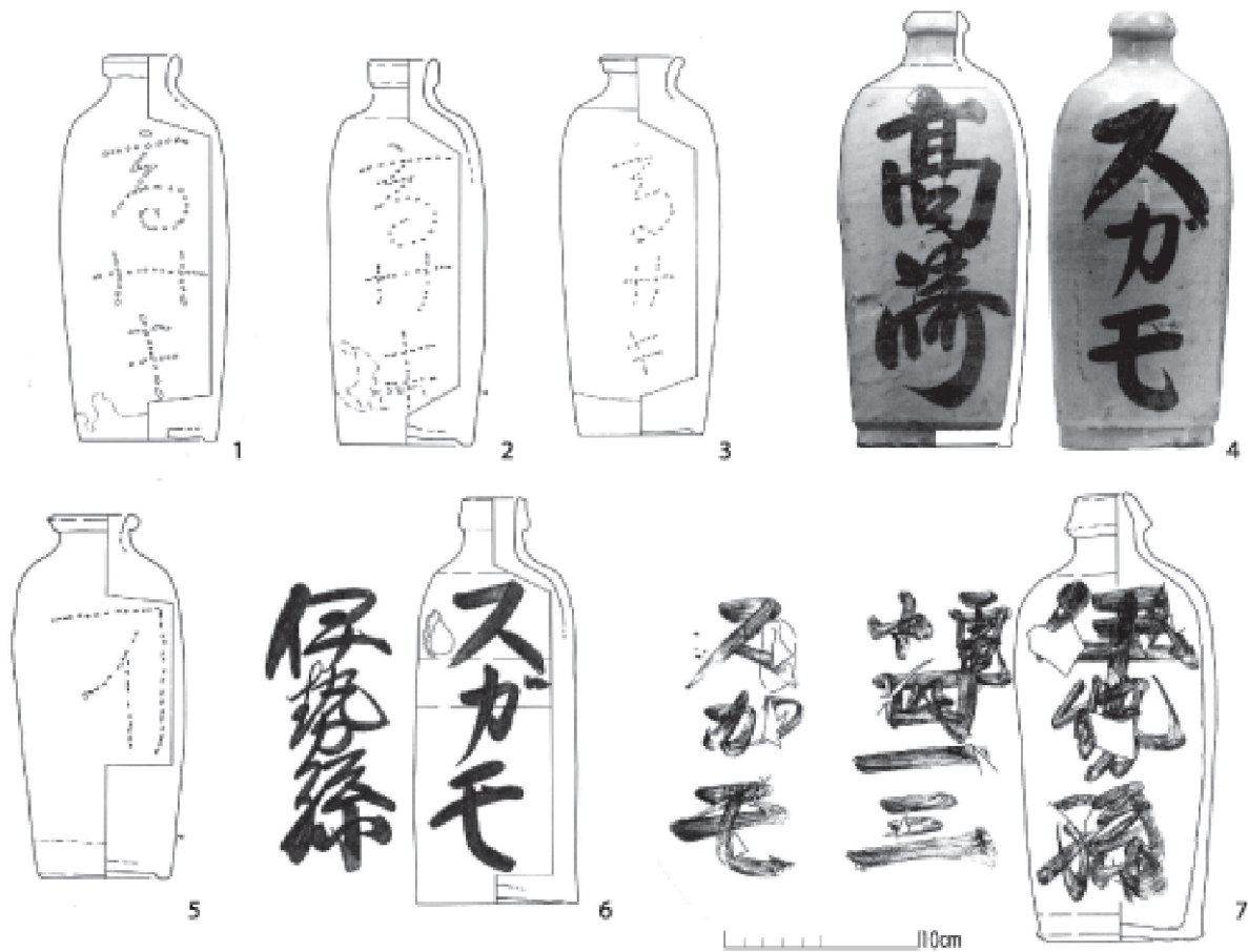
2図 「高サキ」「伊勢孫」徳利等の出土例

から九〇年余り前の一九一九年（大正八）四月以降のことですから、「伊勢孫」の店は大正期にはまだ営業をしていたことがわかります。