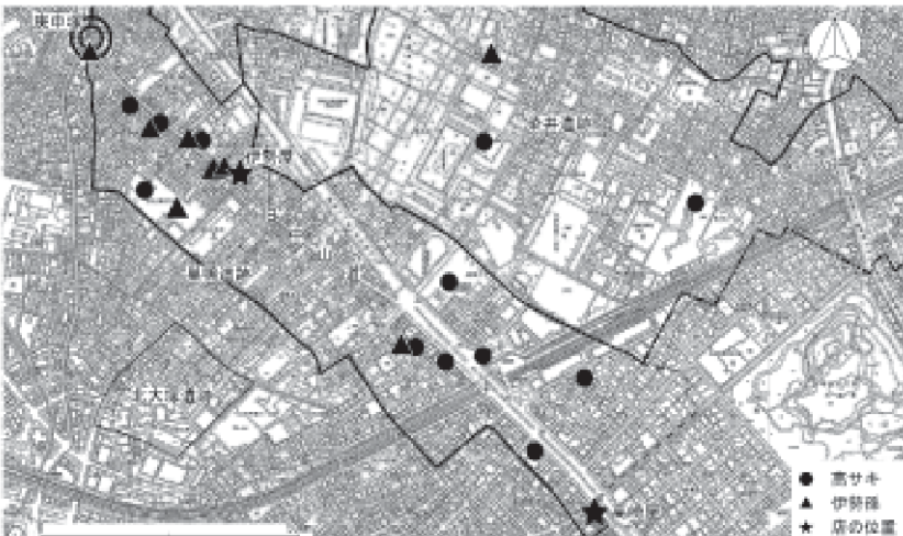
1図 「高サキ」「伊勢孫」徳利等の出土例

す(1図参照)。一方、「伊勢孫」の文字が入った徳利は、今のところ巣鴨町の中でも庚申塚寄り(巣鴨四丁目)に偏在する形で六か所から出土し、ほかには巣鴨三丁目で一か所、駒込七丁目で一か所出土しているだけです(1図参照)。しかも「伊勢孫」徳利は、明治時代以降のものに限られ、「電わ」番号の書かれているものもありました(2図7)。巣鴨で一般人が電話を引けるようになったのは、今