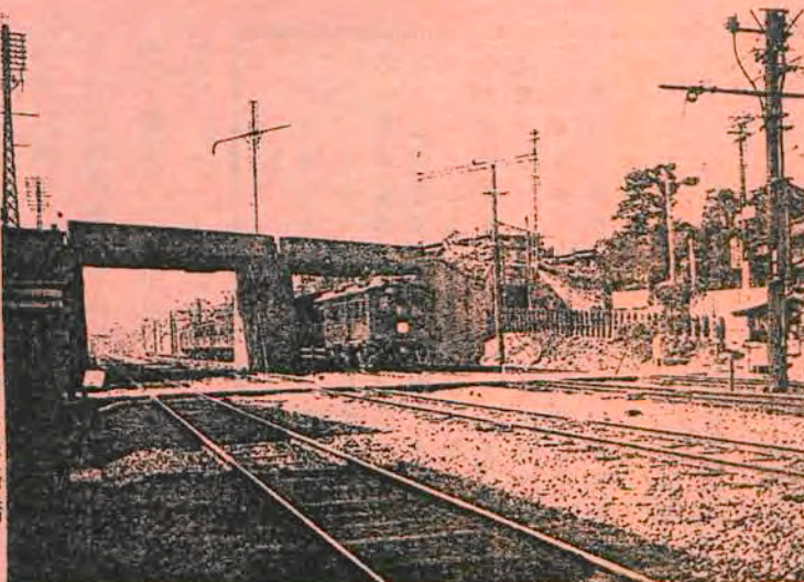
長崎道踏切と跨線道路橋 「高田町史」一九三三年より

ける計画が進んでいます。また山手線に架かる武蔵野鉄道(現西武鉄道)の煉瓦造の橋台(イギリス積み、大正四年築)も、老朽化のため架け替えの計画があり