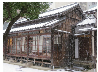
1月 降雪の日の座敷棟