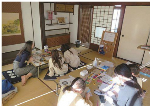
座敷棟でのオーナメントづくりの様子

書斎棟のステンドグラスなど建物内のデザインをモチーフに、プラスチック板で作る自分だけのクリスマス・オーナメント製作を、主に親子参加で募り記念館の座敷棟で行いました。参加者はデザインや色付けに趣向を凝らして思い思いの作品づくりに没頭し、プラスチック板を加熱する仕上げの場面では一瞬で縮んでいく板の様子をハラハラしながら見守る姿も見られました。完成したオーナメントとともに館内に設置したクリスマスツリーの前で記念撮影したり、実際のステンドグラスと見比べたり、それぞれの視点で建物を見学しながら文化財を身近に感じる機会にもなったようです。“自分だけのオーナメント”に参加した子供たちも喜んでいる様子で、「建物の中のモチーフを図案に使っていたのがよかったです。子供にもわかりやすく、楽しく作ることができました。」「今日のような子供と楽しめる工作などがあればいいと思いました。」「季節に合った製作が又あれば参加したいと思います」、「プラスチックオーナメントふしぎでした。とてもきれいに出来てうれしいです。」といった感想をいただきました。