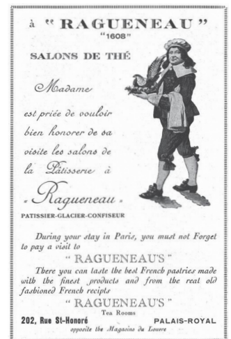
図2 17世紀に実在した菓子職人ラグノオの店の広告(1925年)、公演プログラム『シラノ・ド・ベルジュラック』(ボルト・サン＝マルタン座、パリ、1925年12月30日、当館蔵)より