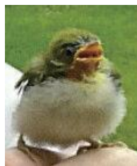
6月 メジロの巣立ち雛 を庭で発見