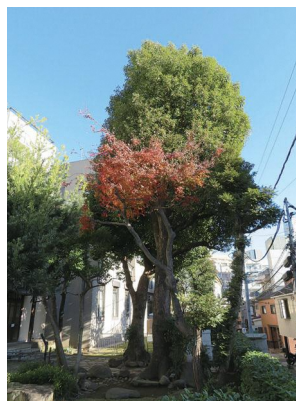
11月 庭のクスノキとモミジ