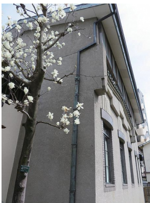
3月 ハクモクレンと書斎棟