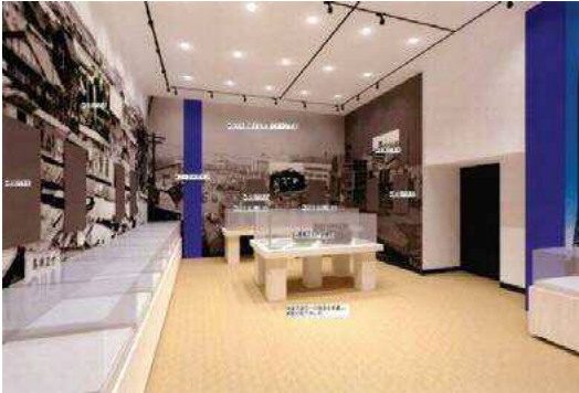
郷土資料館特別展イメージ