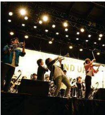
(左) 音楽フェス (イメージ)