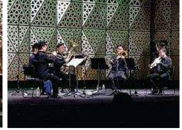
NHK交響楽団メンバーによる金管五重奏