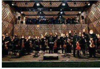
西本 智実 & イルミナートフィルハーモニーオーケストラ