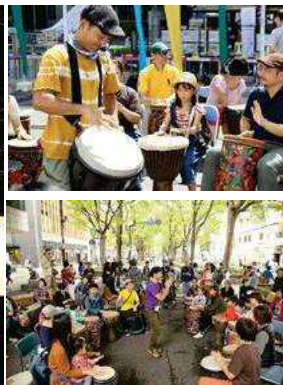
(右上下) ドラムサークル (イメージ)