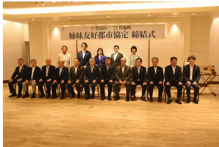
姉妹友好都市協定の締結(長野県箕輪町)

埼玉県秩父市や長野県箕輪町等と、お互いの広報・周知活動や公民連携事業、職員派遣を行っている。