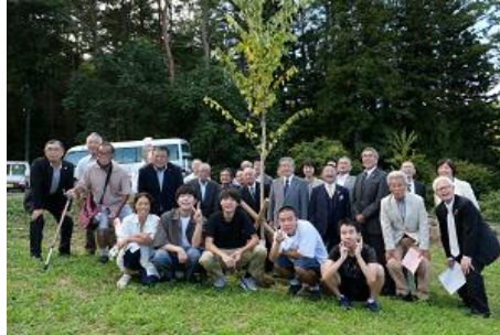
長野県箕輪町での植樹

ソメイヨシノ発祥の地を広くPRするため、桜に係るイベント支援や、ソメイヨシノ苗木の植樹交流などを実施。