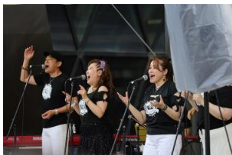
池袋ジャズフェスティバル

豊島区の観光文化活動を促進するために、観光事業を行う団体及び地域の振興を図る地域まつりに対して事業経費の一部を助成する。