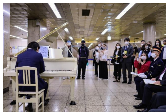
令和4年11月10日 要町駅ピアノ～としまの純真～ オープニングセレモニー