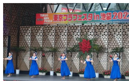
東京フラフェスタ in 池袋 2022