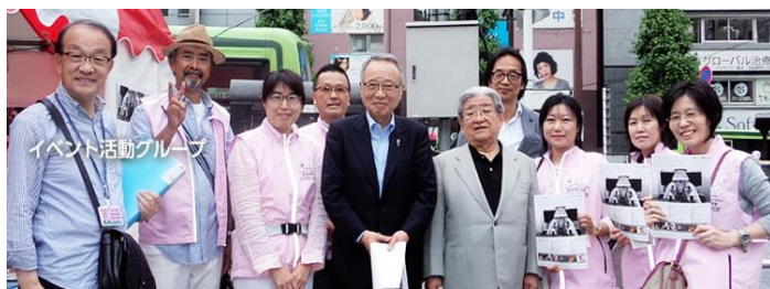
外国語観光ボランティアガイドの会

豊島区観光団体等の育成を図り、多くの来街者が訪れる活気ある観光都市づくりを目指す。