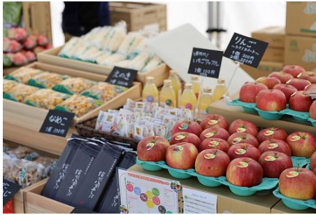
IKE-SUN PARK Farmers Market