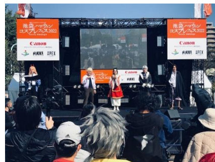
池袋ハロウィンコスプレフェス