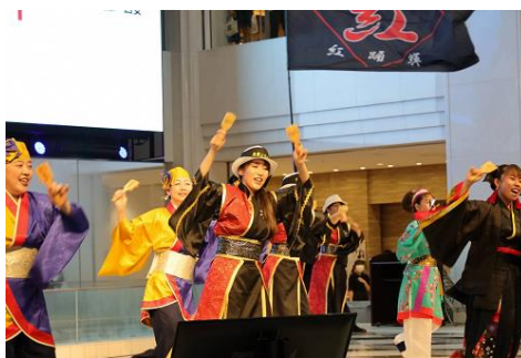
日中学生オンライン交流