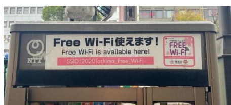
アクセスポイント設置