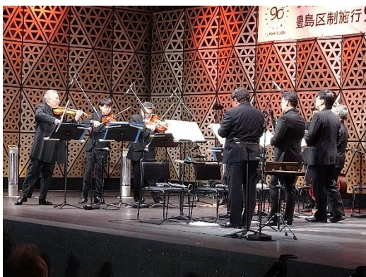
令和4年11月4日公演 Tokyo Music Evening Yube ウィーン・MARO・アンサンブル～N響メンバーによる～

国際文化都市として、心地よいクラシック音楽が流れるまちづくりを区内全域で展開していく。令和4年11月10日には、「要町駅ピアノ～としまの純真～」が常設オープン。