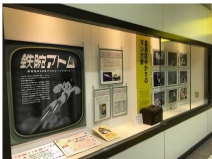
椎名町駅ギャラリー