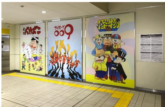
椎名町駅のモニュメント