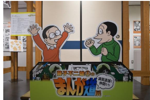
特別企画展「藤子不二雄 ® のまんが道展」 2022.11.11～2023.3.26