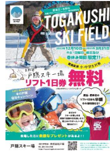
親子滑走支援事業(長野市)