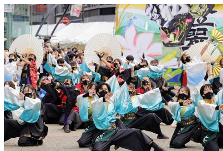
ふくろまつり(東京よさこい)