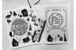
大正大学附属図書館と巣鴨図書館をつなぐスタンプラリー