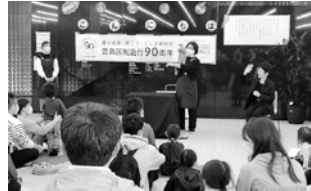
区立図書館司書によるおはなし会

豊島区立図書館は、多くの人に身近な場所で、多くの人に利用される「にぎやかな公共図書館」をみなさんと一緒に作り上げていく取組を進めています。11月3日～5日に、区内の大正大学附属図書館とともに「にぎやかな図書館祭」を開催しました。「おはなし会」「ブックカバーづくり」「図書館見学ツアー」など、地域の方にひらかれたイベントを大学・学生ボランティア・区立図書館司書がタッグを組み企画をし、多くの方に楽しんでいただきました。また、最終日には、出版社や図書館関係者による座談会フォーラム「本を通して“人”がつながる」より、それぞれが考える「にぎやかな図書館」を発信しました。「図書館」という共通のキーワードをもった大学と区が、新たな協働の場をつくりあげた3日間となり、多くの人が集う「にぎやかな図書館祭」になりました。