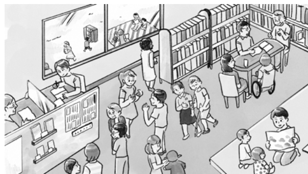
「にぎやかな公共図書館イメージ」

赤ちゃんから大人まで、多くの人に来てもらえる図書館をめざす。本が人と人をつなぎ、図書館が家でもなく職場でもない、本を通じた第三の居場所「サードプレイス」になればと思います。小さな子どもが面白い本を見つけて思わず笑ったり、兄弟で本を読み聞かせたりする場面、とても区立図書館らしい、温かい景色です。「こんにちは」のあいさつ、新聞や雑誌をそっとめくる音、静かだけにぎやかで明るい、「音」のある公共図書館、みんなで作るみんなの図書館をめざしています。「なんだか、ほっとするなあ」と感じる、お互い様で温かい図書館。このイラストのように、図書館は外にも出かけていきます。そんな図書館になれば、にぎやかな公共図書館の完成です!