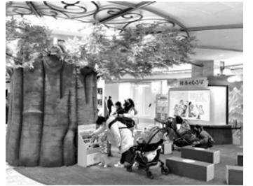
親子でにぎわう「サンシャインシティ 絵本の森」

本や図書館は、歴史や文化を受け継ぎ、地域社会や自身と深く向き合える魅力があります。そして今、さらに願うのは、本や図書館を通して益々豊かな出会いやコミュニケーションが生まれてほしい、ということです。区制施行100周年に向けて、いま豊島区は、「ひと」が中心のまちづくりが大きく進んでいます。歴史や文化の宝庫である本や図書館を通じて「ひと」と「ひと」がつながり、その輪が広がるまこと未来を、皆でつくっていただければと思います。