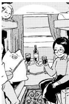
イラスト：織田博子

乗車時に軽い自己紹介を済ませると、あとはひたすら暇をつぶすのみ。何杯も入れて薄くなった紅茶のパックに牛乳を注ぎ、飲み、木と電線しか見えない車窓の風景を眺めながらのお供は「青空文庫」(著作権の消滅した作品を読むことのできるアプリ)。そこで出会ったのは