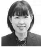
*にじいる図書館は、清和小学校の図書館の名称です。

1989年から現在まで、東京都の教員として勤務。豊島区には、2009年から勤務。2019年より現職。富士見台小学校で図書館改修に関わる。現任校では、豊島区教育委員会研究開発指定校として「自分の考えをもち、表現する児童の育成～地域図書館と学校図書館の活用を通して～」を研究主題として取り組んでいる。