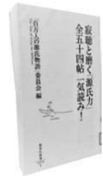
■「寂聴と磨く「源氏力」全五十四帖一気読み！」 [百万人の源氏物語]委員会／著 集英社 2006年

好例の一つを紹介したいと思います。葵巻に、急逝した正妻葵の上を源氏が哀悼しているくだりがあります。夕霧誕生という慶事に加え、葵の上への愛情が深まっていた時だけに、源