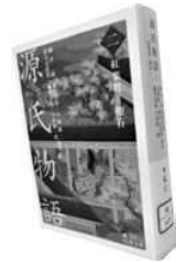
■「源氏物語(二) 紅葉賀一明石」 柳井滋、室伏信明、大朝雄一、 鈴木日出男、藤井貞和、 今西祐一郎／校注 岩波書店 2017年

氏の悲嘆は深いものでありました。源氏は葵の上の火葬を終え、哀悼の一首を詠じています。左大臣邸に帰った源氏は、まどろむこともなく追憶の中でさらに一首の哀傷歌を独詠、そして経文を念誦して「法界三昧普賢大士」と唱えています。さて、ここでなにゆえ源氏がこの文言を唱えたのが問題となります。というのは、この場面から判断すれば、極楽往生を祈念して「阿弥陀仏」と唱えた方が自然であるように思われます。しかし、普賢菩薩に対する祈りの内容やこの文言を誦した源氏の葵の上に対する心理などについてはほとんど語られていません。おそらく当時の源氏の読者にとっては説明する必要はなかったものと考えられます。ですが、現代の読者にはその理由が全くわかりません。私たちは、源氏がどんな思いで「法界三昧普賢大士」と唱えたかを知りたいところです。複数の学者の研究書を調べても全て全く言及されておりません。そこで当時の普賢信仰を調べてみると、普賢菩薩が地獄に落ちる人に付き添って、地獄での苦しみをその人に代わって受けて救ってくださり、阿弥陀の浄土に往生させてくれるという信仰があったことが、ある歌人の歌の詞書から判明するのであります。そうしますと、「法界三昧普賢大士」とその名を、源氏が唱えることで、葵の上が死後一人で赴かなければならない死出の山路や地獄の世界まで思いやり、その孤独と恐怖・苦しさが軽減されるように祈り、極楽浄土への往生を祈願していることが明らかになるのです。これまでの研究では普賢菩薩の思想と信仰が不明だったため、葵の上を深く思いやる源氏の祈りの内容がわからなかったのです。このように、当時の仏教の思想信仰を介在させないと、源氏の葵の上を思いやる感動的な祈りが理解できないのです。「源氏力」を高める知識として仏教理解を重視する所以です。なお、この説は最新の研究成果を紹介した岩波文庫『源氏物語(二)』の左注で紹介されています。