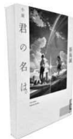
■小説「君の名は。」 新海誠／著 KAKO KAWA / 角川文庫 2016年

立教大学江戸川乱歩記念大衆文化研究センター助教。1981年(昭和56年)静岡県生まれ。立教大学大学院文学研究科日本文学専攻博士後期課程修了。博士(文学)。専門は近現代日本演劇・文学・文化。著書に『高安月郊研究——明治期京阪演劇の革新者』(晃洋書房、2018)、編著に『ロスト・イン・パンデミック——失われた演劇と新たな表現の地平』(春陽堂書店、2021)、『小劇場演劇とは何か』(ひつじ書房、2022)など。