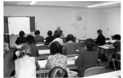
*受講をご希望の方は、文庫本で「万葉集」をご用意いただけます。詳しくは、下記までお尋ねください。

受講生を募集するとすぐにいっぱいになるのだが、日が経つと少し空席がでる。わずかだが、受講を希望される方をお迎えできる。