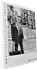
■「パンツを脱いだあの日から」 マホムッド ジャケル／著 こま書房新社 2022年 日本という国で生きる

祖国では「生まれた瞬間3kgの米と交換されそうになった」という壮絶な体験をした。—