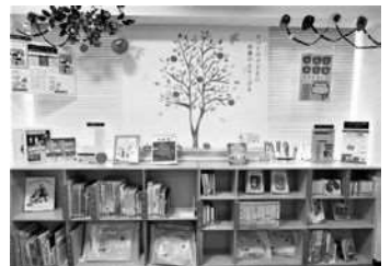
バリアフリー図書をそろえた「りんごの棚」（豊島区立中央図書館 4階）

誰もが読みたい本を自由に読むことのできる社会をつくるため、すべての人の知る権利と公平利用を保障する公共図書館としての使命を、読書バリアフリーを通じ果たしていきます。