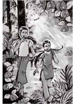
イラスト：織田博子

教育によって道を切り開いていく様子は感動的。一方で、人種差別によって道が絶たれ、絶望する様子には、胸がつまる思いがする。