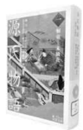
■源氏物語(一) 桐翠 末摘花 柳井滋・室伏信助・大朝雄一・鈴木白出男・藤井昌和・今西祐郎/校注 岩波書店/岩波文庫 2017年

以上のように「普賢菩薩の乗り物である白象の赤い鼻」という表現の背後には物語展開上の重要なファクターが埋め込まれていたといえましょう。