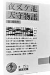
■夜叉ケ池 天守物語 泉鏡花 作 岩波書店/岩波文庫 1994年

今年は鏡花の生誕150年にあたる。鏡花作品を演じる玉三郎の舞台や映像を通して、新派というジャンルで連綿と受け継がれてきたに違いない喜多村のおもかげをも想像してみる。文庫本を手には雑司が谷へ。二人の墓参をするのも一興ではないだろうか。