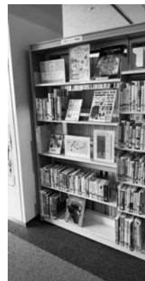
図1 古代オリエント関連図書を展示

さて、秋の特別展「おまもりとハンコとコイン 古代オリエントの偉大なる小さきものたち」では、古代エジプトのおまもり(スカラベや護符)、メソポタミアのハンコ(円筒印章やスタンプ印章)、そして古代オリエントに生まれたコインなどが並びます。小さな工芸品ではありますが、その一つ一つに膨大な情報が詰まっている資料ばかりです。図書コーナーでは、そんな魅力的な展示資料にまつわる図書をご紹介しますと当館研究員も考えておりますので、この秋はぜひ、古代オリエント博物館と豊島区立中央図書館に足をお運びください。