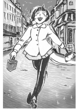
イラスト：織田博子

旅は人を丸裸にする。自分そのものに戻った時、あながい人がやることは「ご飯を食べ、人と話し、寝る」だったりする。私もウズベキスタンのバザールですいかを買い、シベリア鉄道でミルクティーをすすりながら同乗者と話し、バングラデシュの田舎の蚊帳の中で眠った。そのなんでもないことが、一つ一つ心に残る宝物になっている。そしてその宝物は、旅を終えた後も、自分の人生をキラキラと輝かせてくれる。