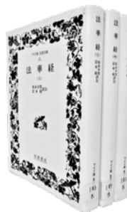
■法華経 上中下 坂本幸男、岩本裕 訳注 岩波書店 / フォント版岩波文庫 1991年

優曇華のことは多くの平安貴族が、法文授受の場や法会の講経・聴聞の場で見事に援用しながら源氏の稀有の美しさや、以後物語で展開され到達する栄華の絶頂への伏線となっています。優曇華のことは多くの平安貴族が、法文授受の場や法会の講経・聴聞の場で見事に援用しながら源氏の稀有の美しさや、以後物語で展開され到達する栄華の絶頂への伏線となっています。