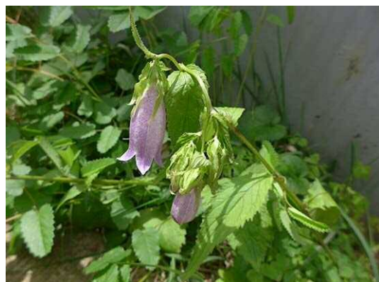
ホタルブクロ (R1年6月4日)