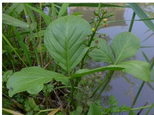
ミツガシワ R1年5月23日 南長崎はらっぱ公園