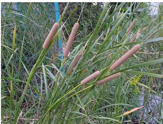
ヒメガマ（R1 年 10 月 17 日）

草地の所々にグランドカバーとして用いられるアオイゴケ属の一種が見られた。その他、ビオトープ南東側の草地に外来種のコネズミガヤが多く広がっていた（図Ⅲ－１－３）。