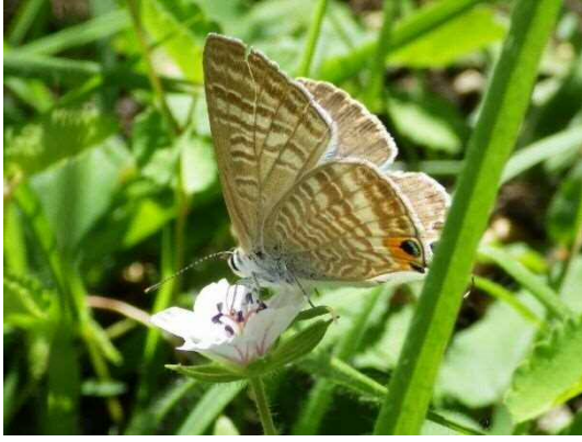
ウラナシジミ (R1 年 9 月 25 日 池袋本町小学校)