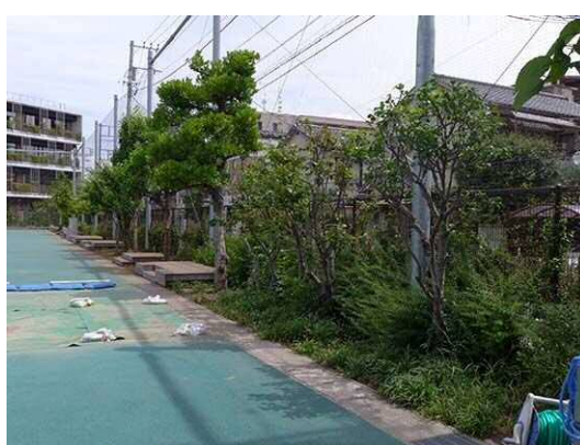
グラウンド沿いの植栽