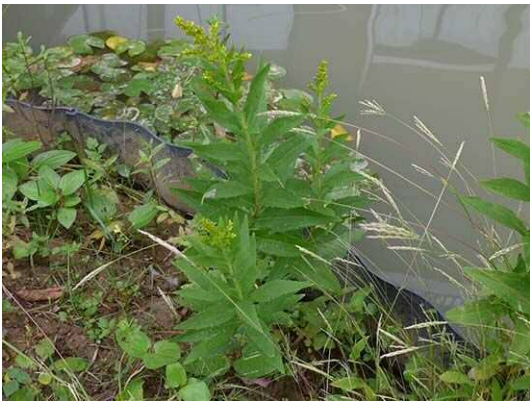
セイトカアワダチソウ (R1年6月4日 池袋本町小学校)