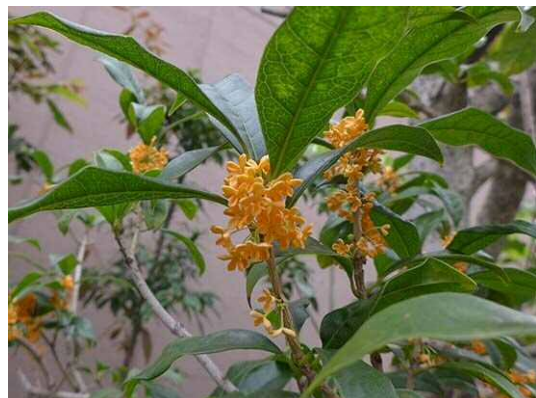
キンモクセイ (R1年10月17日)