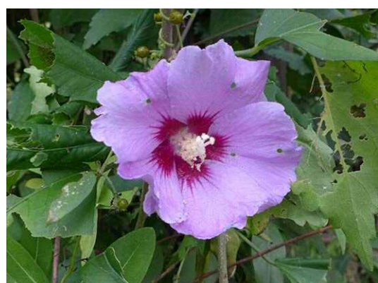
ムクゲ（R1 年 10 月 17 日）