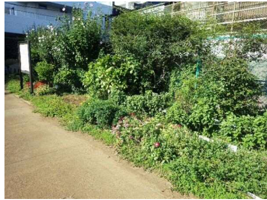
ビオトープ脇の花壇