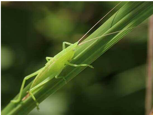
クビキリギス幼虫 (R1年9月25日 南長崎はらっぱ公園)