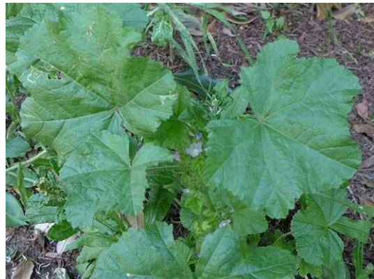
ミナミフランスアオイ (R1年5月23日 南長崎はらっぱ公園)