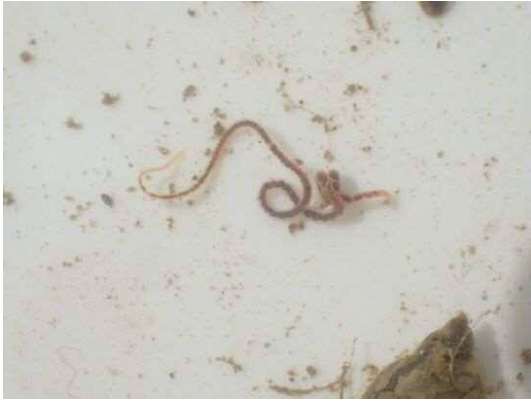
ミズミズ科の一種 (R2年2月21日)