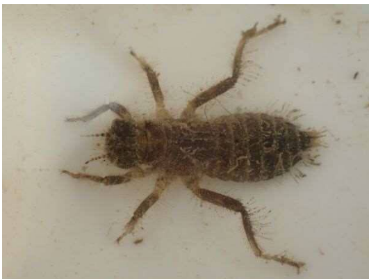
シオカラトンボ属の一種 (R2年2月21日)