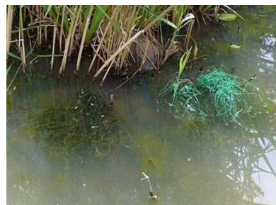
設置状況（プラスチック製）