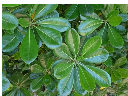
トベラ(R1 年 5 月 23 日)