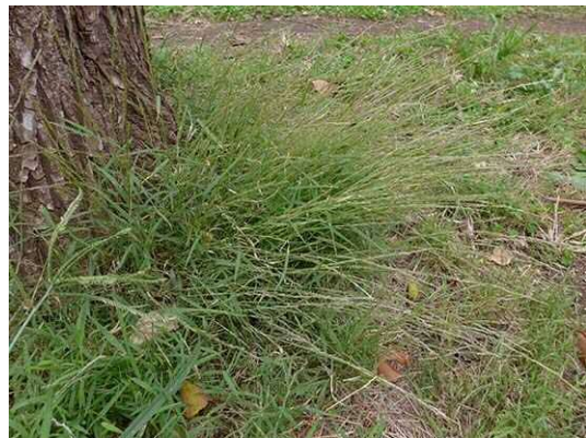
コネズミガヤ (R1年10月21日 南長崎はらっぱ公園)