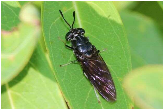
アメリカミズアブ