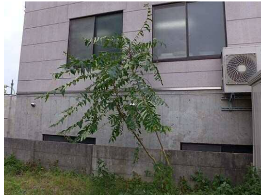
シンジュ(左と同じ個体) (R1年10月21日 南長崎はらっぱ公園) 高さが倍くらいになっている。