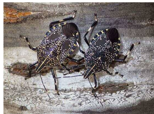
キマダラカメムシ (R1 年 9 月 25 日 池袋本町小学校)