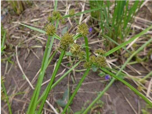
タマガヤツリ (R1年10月17日)