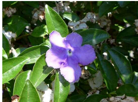
ニオイバンマツリ (R1 年 5 月 23 日)