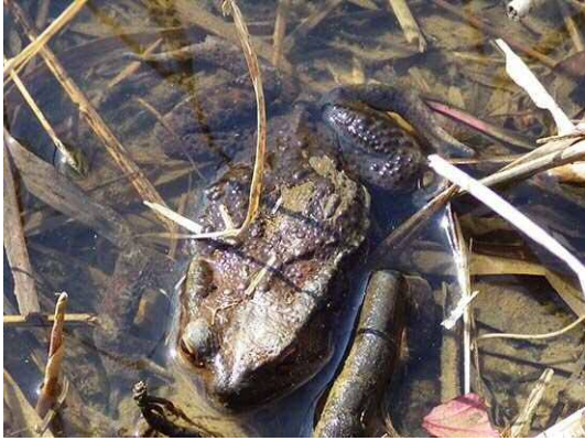
アズマヒキガエル成体 (R2年2月21日・南長崎はらっぱ公園)