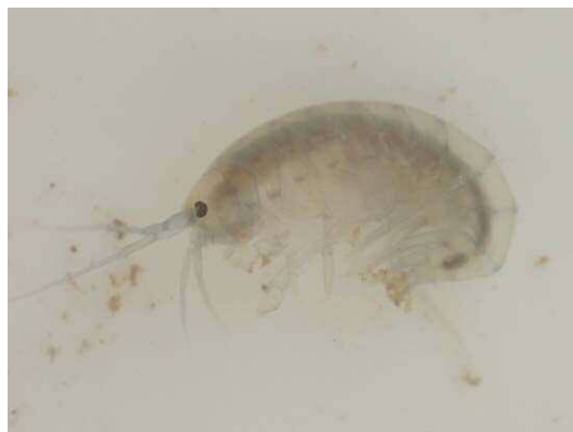
フロリダマミズヨコエビ (R2年2月21日 池袋本町小学校)