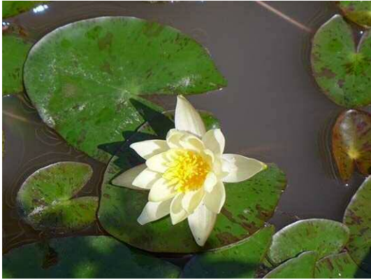
スイレン属の一種 (R1年9月25日)