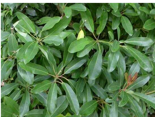
ユズリハ(R1 年 10 月 17 日)