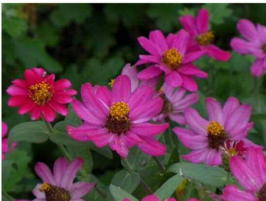
ヒャクニチソウ属の一種(ジニア) (R1 年 10 月 17 日)