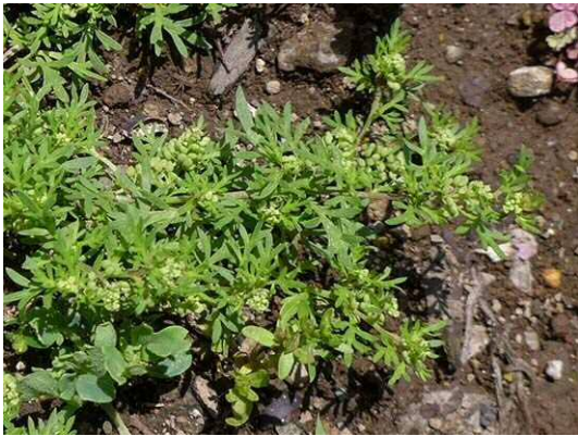
カラクサナズナ (R1年5月23日 南長崎はらっぱ公園)

また、南長崎はらっぱ公園のビオトープ南東側の草地に外来種のコネズミガヤが多く広がっていた。池袋本町小学校の東南側のグラウンド沿いの緑地にはワルナスビが生育していた。葉や茎にトゲが多く児童が近づきやすい場所にあるため、除草することが望ましい。