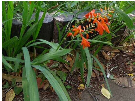
ヒメヒオウギゼン (R1 年 6 月 20 日 南長崎はらっぱ公園)