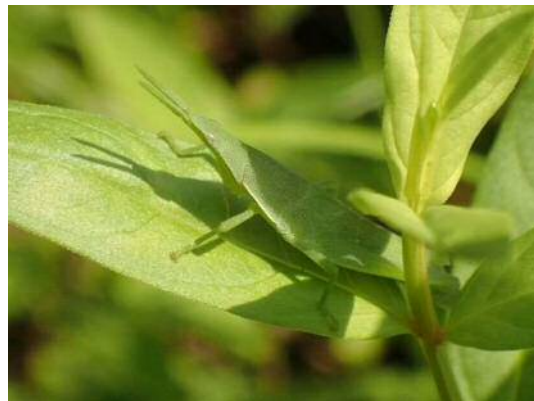
オンブバッタ(幼虫) (R1年7月29日 池袋本町小学校)