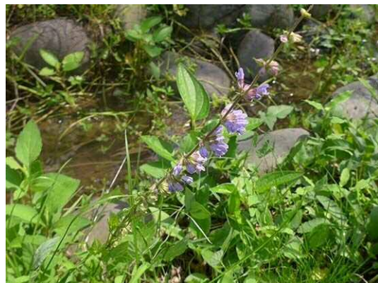
アキノタムラソウ (R1年7月29日)