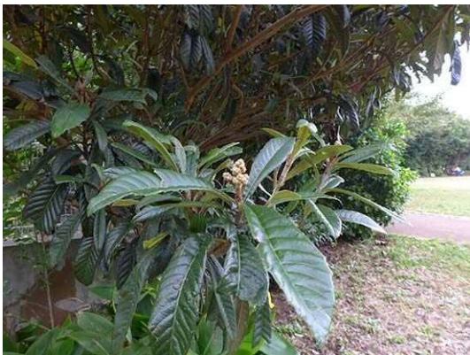
ビワ (R1 年 10 月 21 日 南長崎はらっぱ公園)