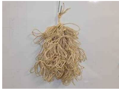
麻紐で作成した人工藻