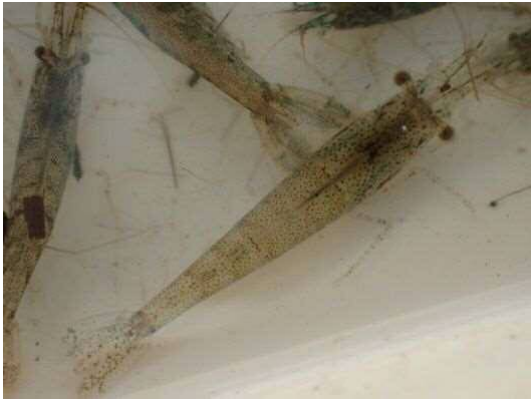
ヌカエビ(左側はカワリヌマエビ属の一種) (R2年2月21日)