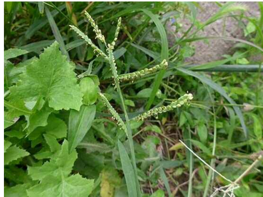
スズメノヒエ (R1年10月17日)