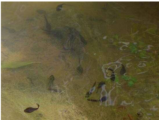
アズマヒキガエル幼生 (R1年6月4日・池袋本町小学校)