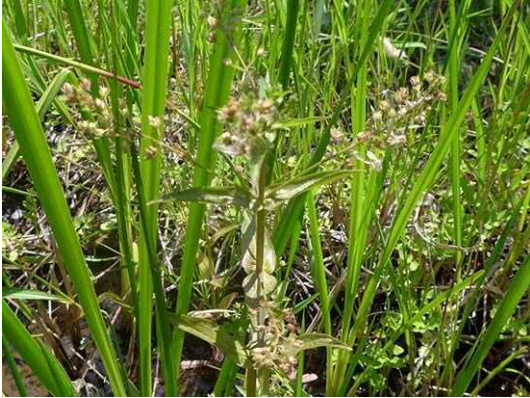
オオカワヂシャ (R1年5月23日 南長崎はらっぱ公園)