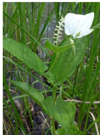
ハンゲショウ R1年6月20日 南長崎はらっぱ公園