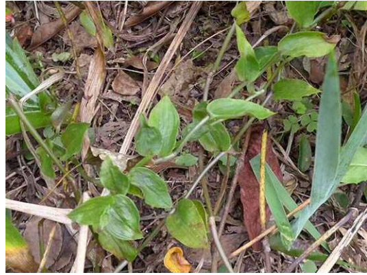
ノハカタカラクサ (R1 年 10 月 21 日 南長崎はらっぱ公園)