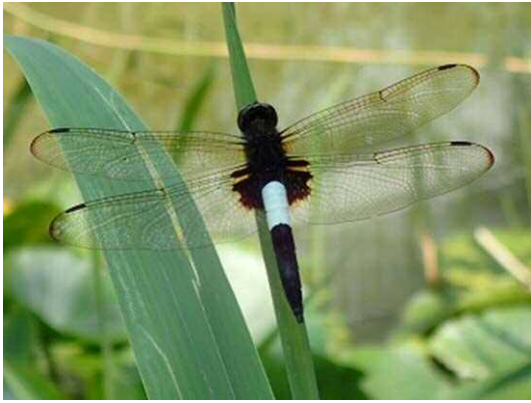
コシアキトンボ (R1年7月29日 南長崎はらっぱ公園)