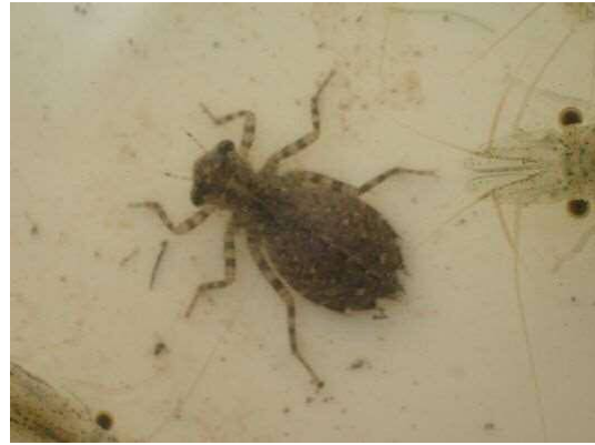
コシアキトンボ (R1年9月25日)