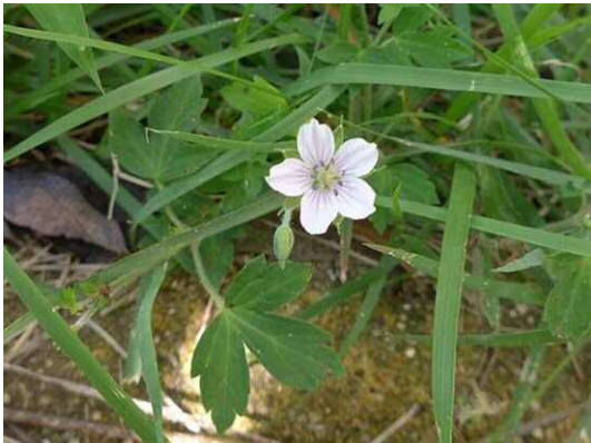
ゲンノショウコ (R1年9月25日)