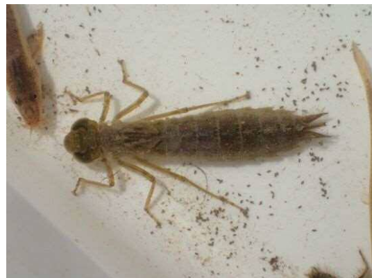
クロスジギンヤンマ (R1年9月25日)