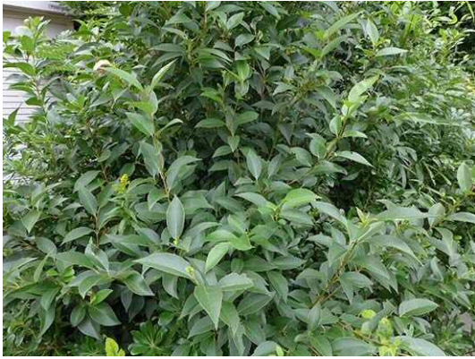
トウネズミモチ (R1 年 10 月 21 日 南長崎はらっぱ公園)