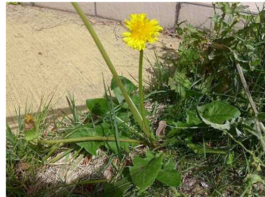
セイヨウタンポポ (R1年6月4日 池袋本町小学校)