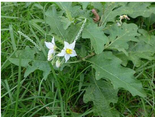
ワルナスビ (R1年7月29日 池袋本町小学校)