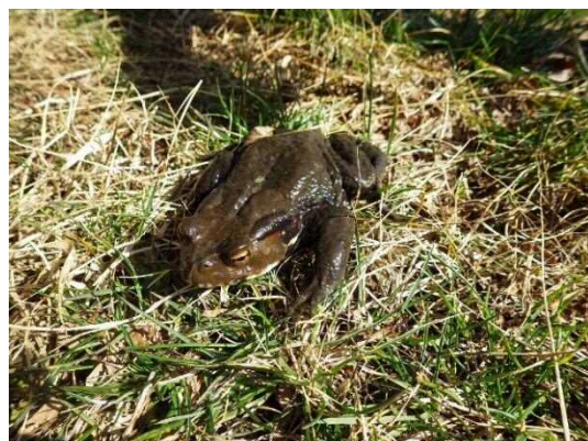
アズマヒキガエル成体 (R2年2月21日・池袋本町小学校)