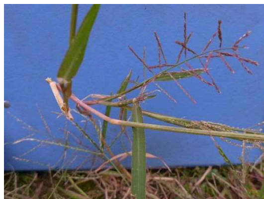
アゼガヤ R1年10月17日 池袋本町小学校