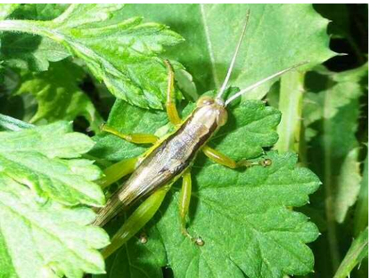
ハネナガイナゴ (R1年9月25日 池袋本町小学校)