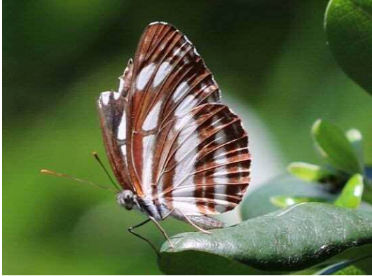
コムスジ (R1 年 9 月 25 日 南長崎はらっぱ公園)