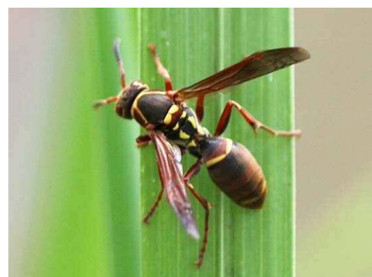
コアシナガバチ (R1 年 9 月 25 日 南長崎はらっぱ公園)