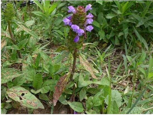
ウツボグサ (R1年6月4日)