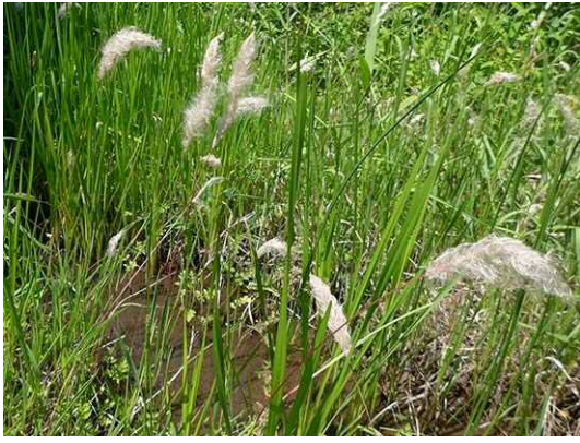
チガヤ (R1 年 5 月 23 日)