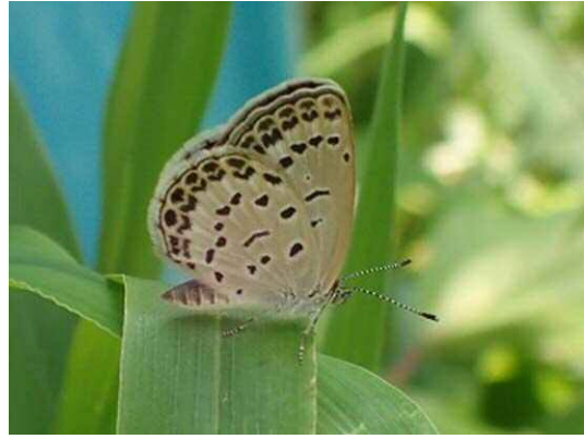
ヤマトシジミ (R1 年 7 月 29 日 池袋本町小学校)