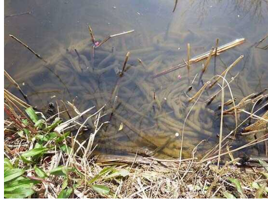
アズマヒキガエル卵塊 (R2年2月21日・南長崎はらっぱ公園)