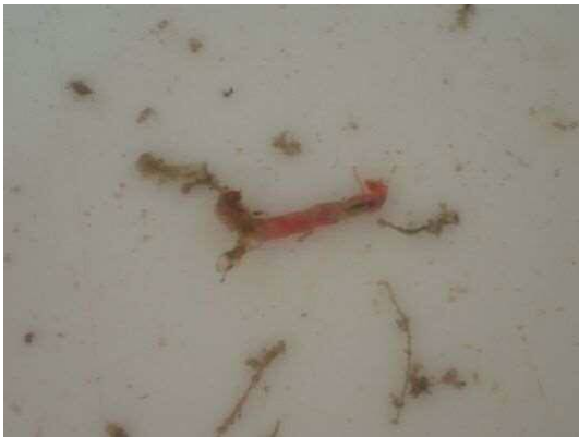
ユスリカ科の一種 (R2年2月21日)