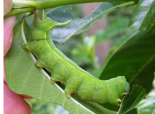
オオスカシバ幼虫 (R1 年 9 月 25 日 南長崎はらっぱ公園)