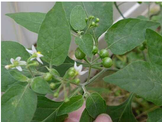
テリミノイヌホオズキ (R1年10月21日 南長崎はらっぱ公園)