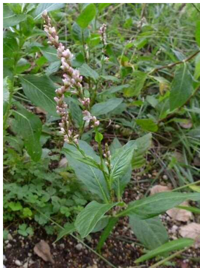
サクラタデ R1年10月17日 池袋本町小学校