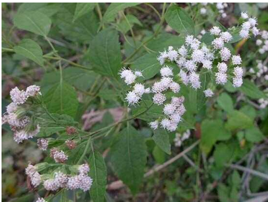
マルバフジバカマ (R1 年 10 月 17 日 南長崎はらっぱ公園)