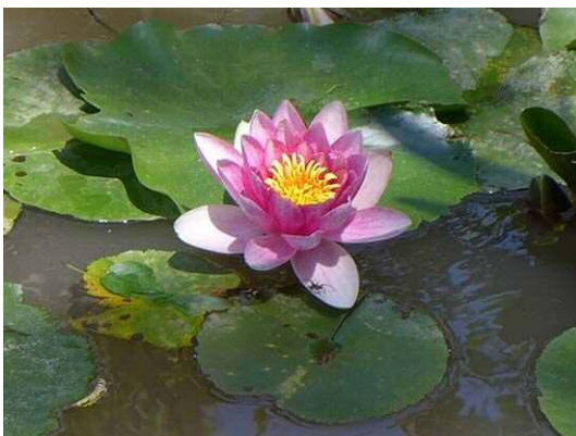
スイレン属の一種(ヒメスイレン) (R1 年 7 月 29 日)