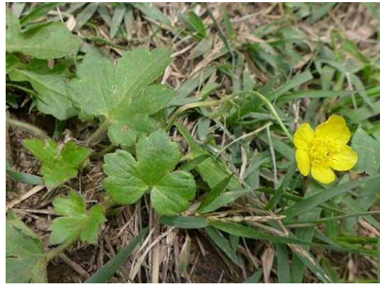
ウマノアシガタ (R1年6月4日)