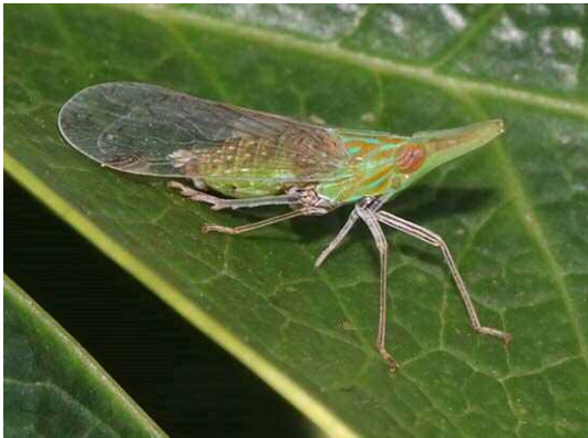
テングスケバ (R1 年 9 月 25 日 池袋本町小学校)