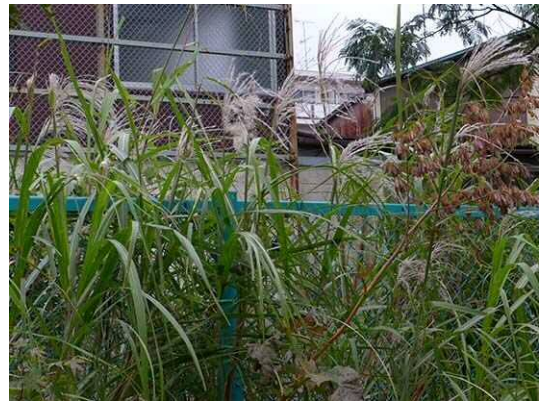
オギ (R1 年 10 月 17 日)