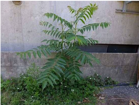
シンジュ (R1年5月23日 南長崎はらっぱ公園)