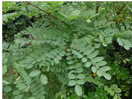
ハリエンジュ (R1 年 10 月 21 日 南長崎はらっぱ公園)