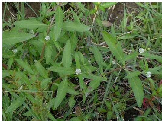
アメリカタカサブロウ (R1年9月25日)