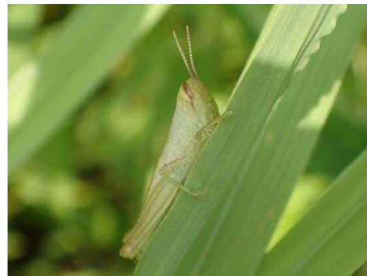
コバネイナゴ(幼虫) (R1年7月29日 南長崎はらっぱ公園)