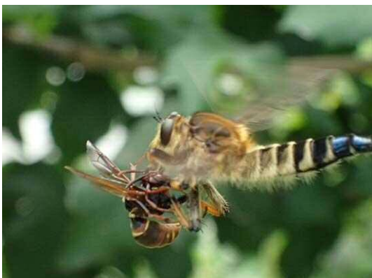
シオヤアブ (R1 年 7 月 29 日 南長崎はらっぱ公園)