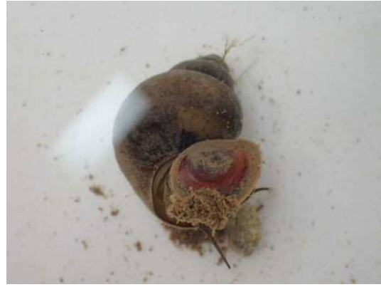
ヒメタニシ (R1年9月25日)