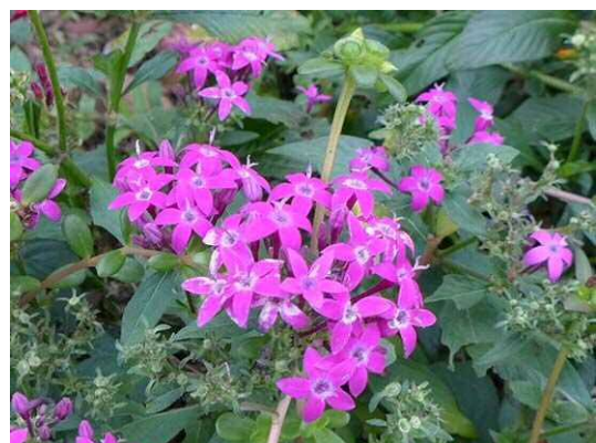
クササンタンカ(ペンタス) (R1 年 10 月 17 日)