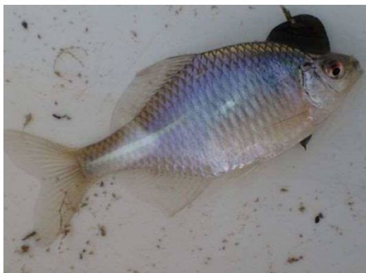
タイリクバラタナゴ (R2年2月21日 南長崎はらっぱ公園)