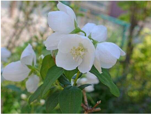
バイカウツギ (R1 年 5 月 23 日)