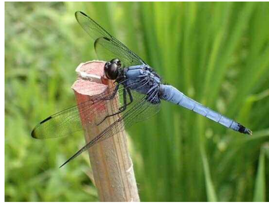
オオシオカラトンボ (R1年7月29日 池袋本町小学校)