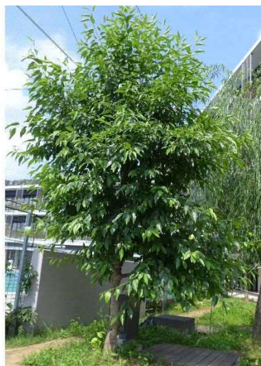
ハシノキ R1年7月29日 池袋本町小学校