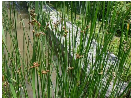
フトイ（R1 年 5 月 23 日）