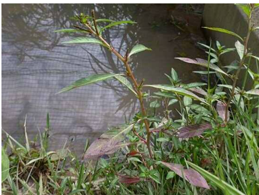
チョウジタデ (R1年9月25日)