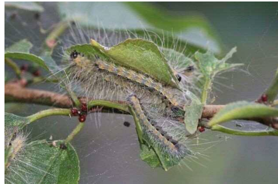
アメリカシロヒトリ幼虫