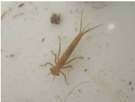
イトトンボ科の一種 (R2年2月21日)