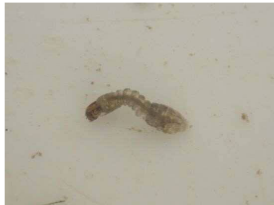
ブユ科の一種 (R2年2月21日)