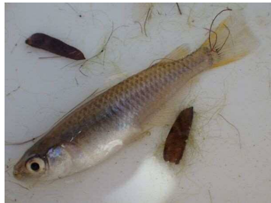
メダカ属の一種 (R2年2月21日)