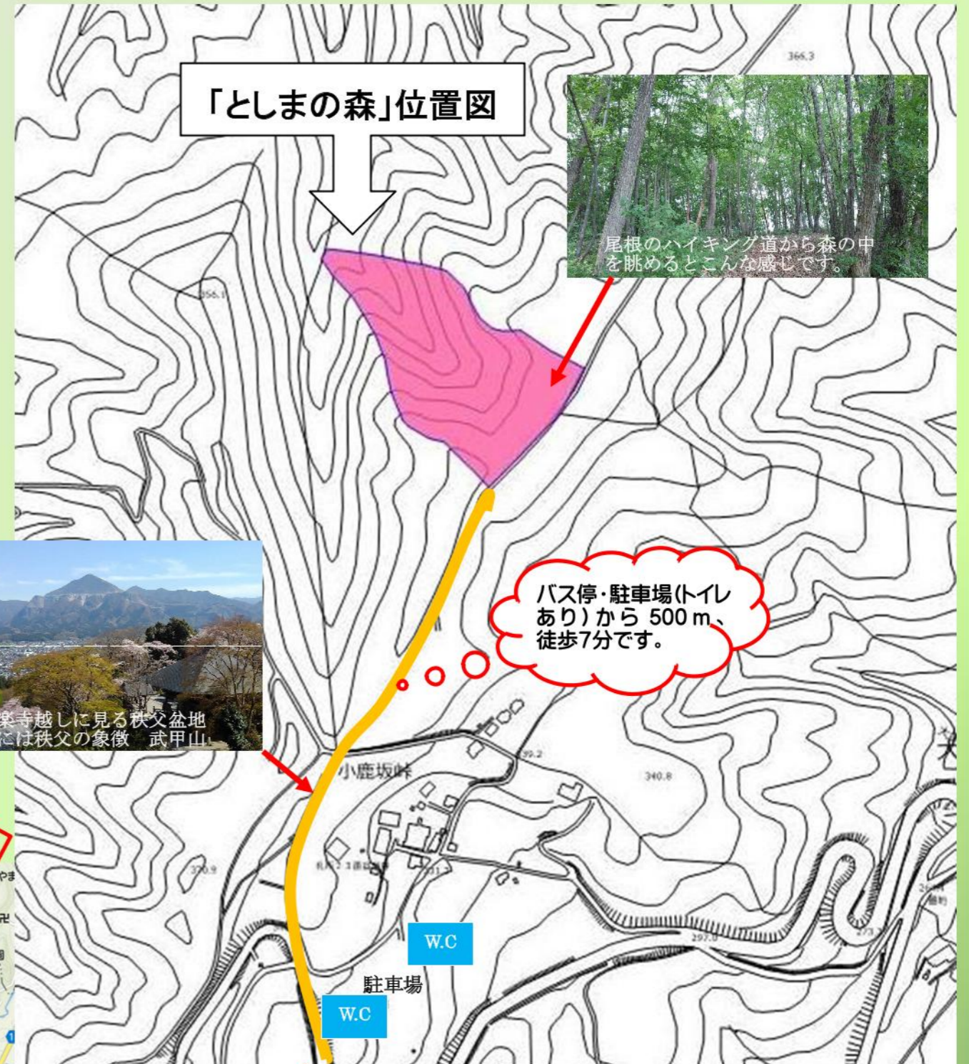
「としまの森」位置図