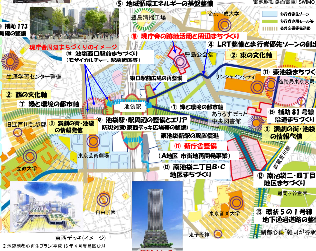
東西デッキ(イメージ) ※池袋副都心再生プラン(平成16年4月豊島区より)