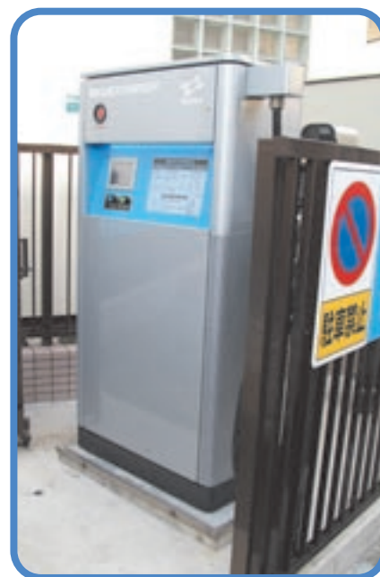
区内唯一の急速充電スタンド

近い将来、電気自動車が普及し、区民の皆さまがこの充電器スタンドをどんどん使っていただける日が来るのを楽しみに待っています。