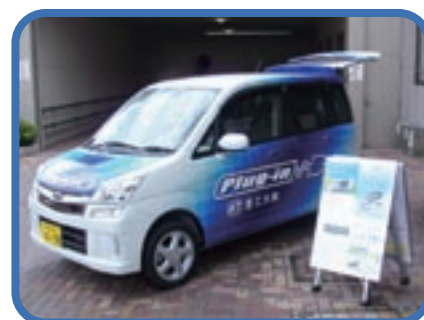
株式会社愛工大興の電気自動車は、植樹祭で高野区長を乗せて、区内の会場を移動しました。